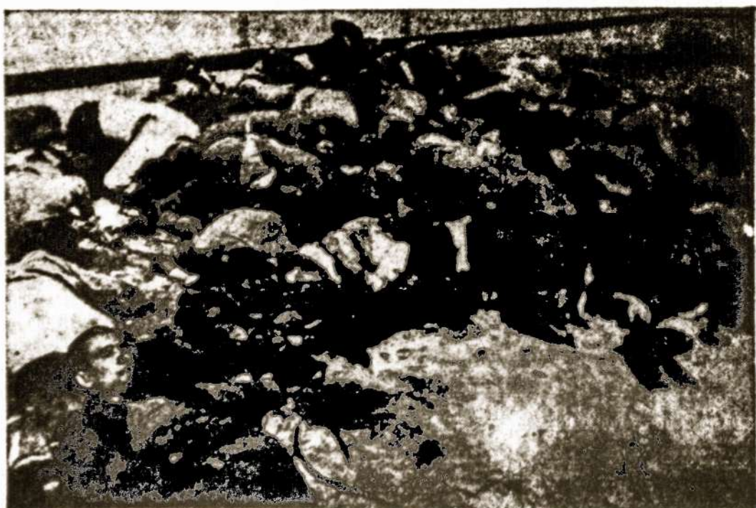
Pravieniškų priverčiamojo darbo stovykloje išduoti kaiziniai

Šios dienos Vliko posėdžio prad- žioje paaiškėjus, kad Vliko dau- guma tebesilaiko savo beteisų ak- tų ir toliau laužo tiek Vliko sta- tutą, tiek jį sudarančių grupių 1954 m. liepos 24 d. vienbalsį susitari- mą, — savo atstovaujamos grupės vardu kartotinais reiškiu griežtą protestą ir, ligi nebus atstatyta tai sėta tvarka, tolimesniuose Vliko posėdžiuose nedalyvausiu.