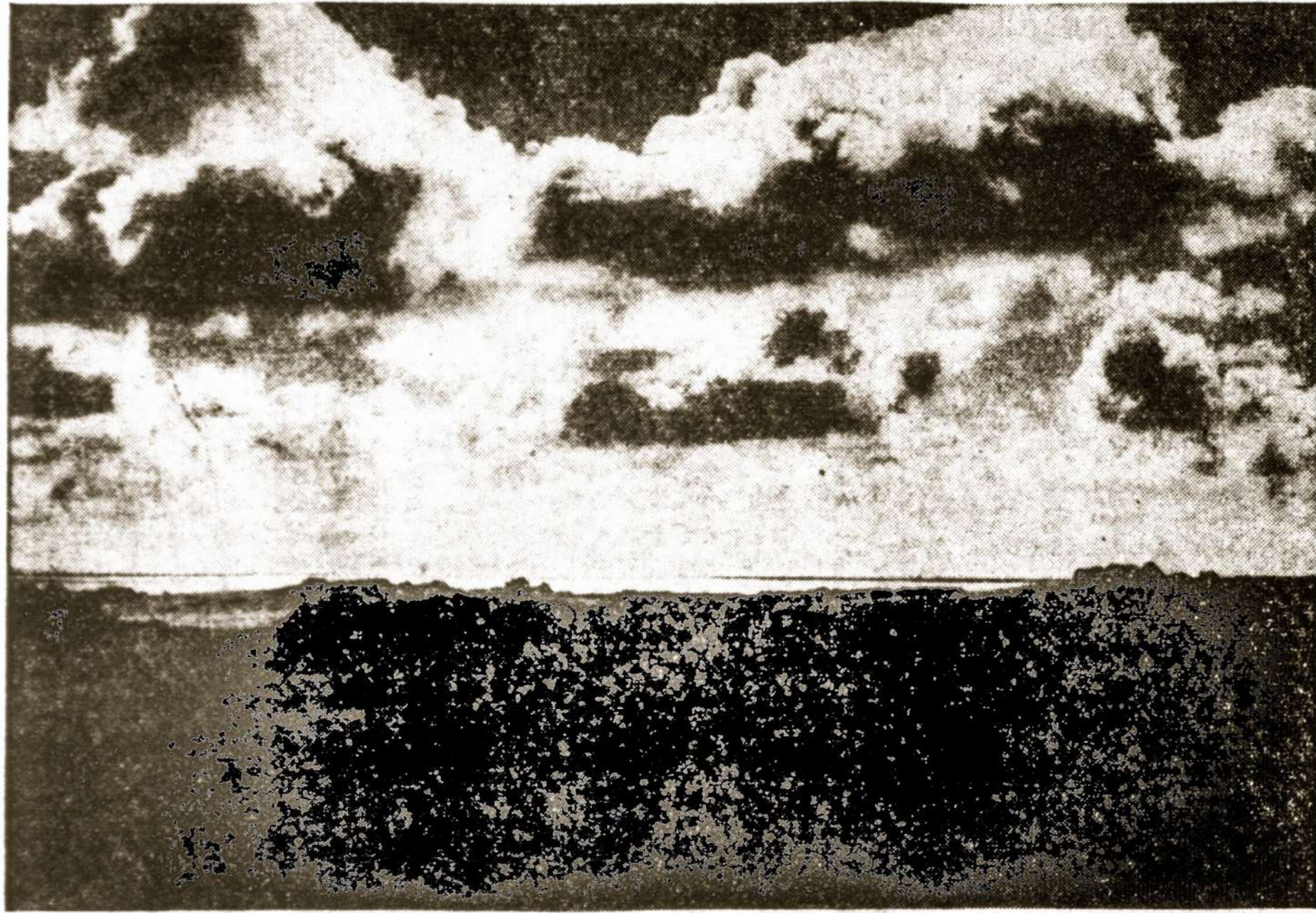
Lietuvišku prakaitu ir ašarom patvino Kuršių marios...