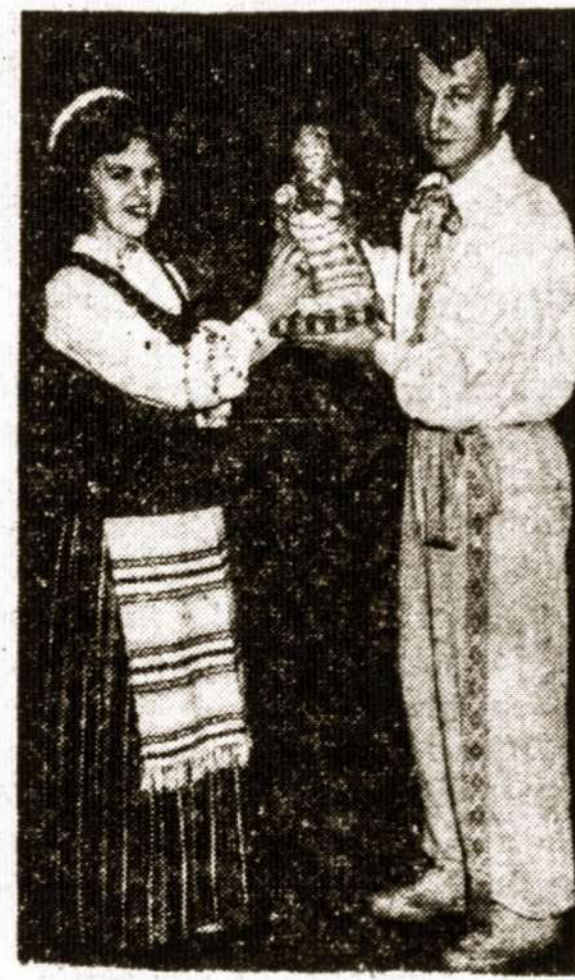
"Ateities" šokėjai atgal į gamtą!