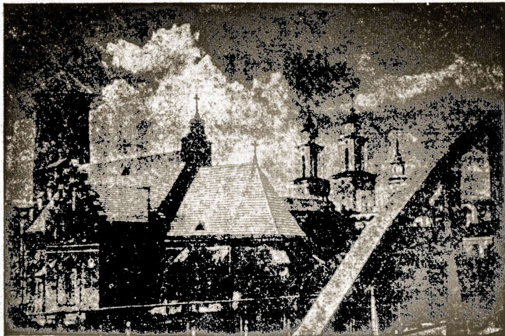
Senos, bet gražios buvo Kauno bažnyčios

Remdamosi dvi paras posėdžiausios specialistų komisijos pranešimu, vyriausybė rekomenduoja vietinėms įstaigoms laikinai suilaikyti nuo skiepijimo. Dr. J. Solk naujais išrastas skiepais, paskutinėmis savaitėmis buvo paskiepijama per 5 mil. vaikų. Tačiau iš jų apie 50 vaikų susirgo paralyžium, daugumoje paskiepijama Cutter laboratorijos pagamintais skiepais. Šis faktas privertė skiepijimą sustabdyti iki bus naujai patikrintas pagamintas serumas.