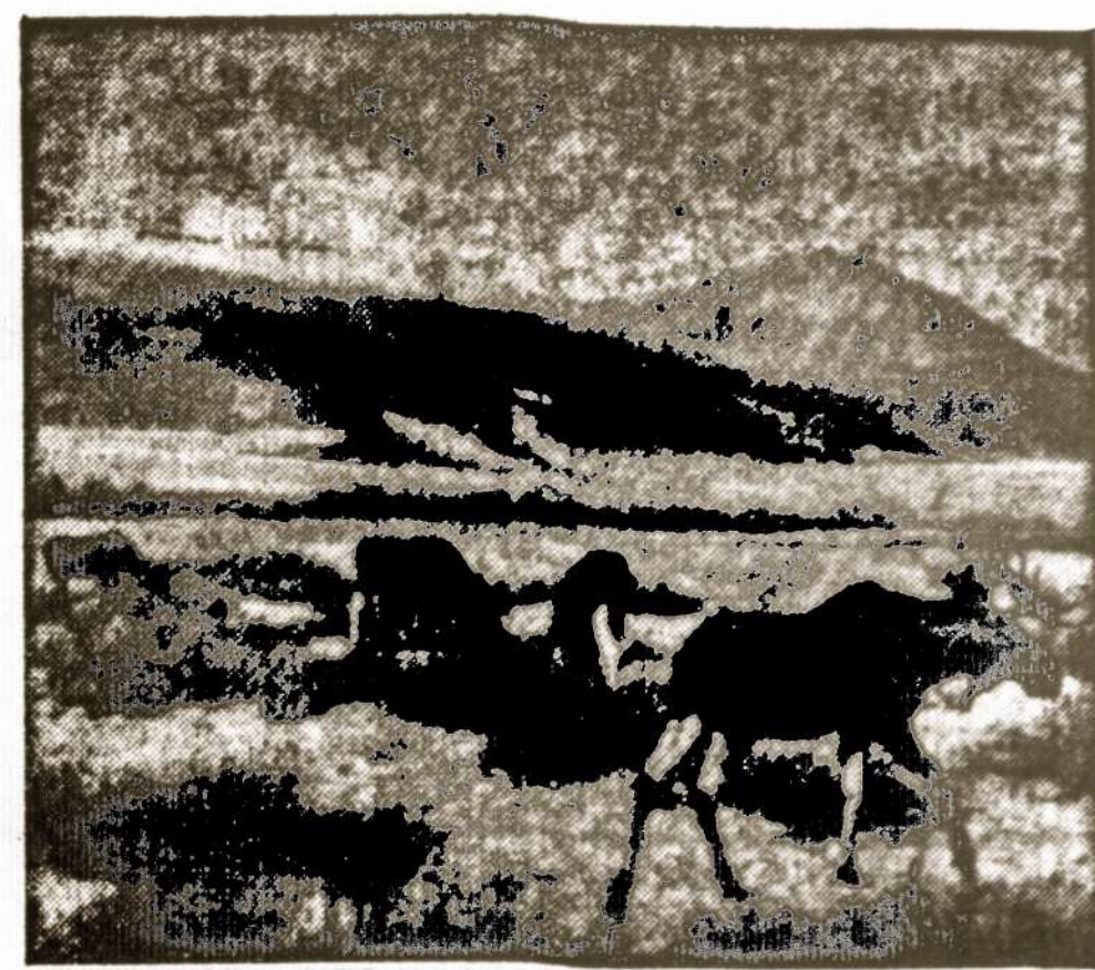
Lietuvos miškų gražuoliai — elniai, Baltijos pajūry.