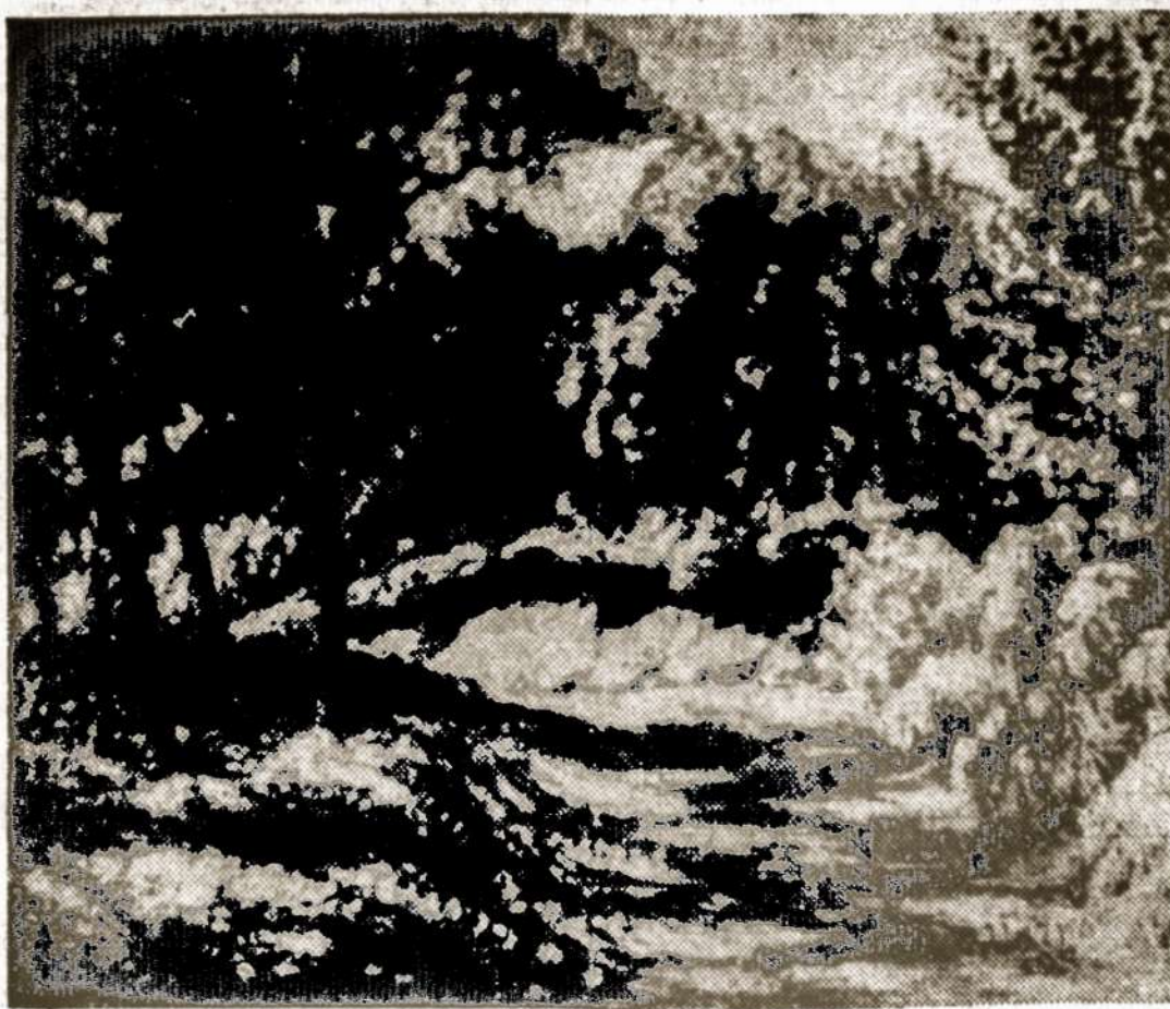
Adomas Varnas —

Prieš metus laiko Dr. J. Salk'o išrastas serumas nuo vaikų paralyžiaus pasirodė veiksmingu. Pernai tuo serumu buvo įskiepyta didelis skaičius vaikų. Dabar buvo suvesta statistika ir pasirodė, kad skiepytų vaikų susirgimas buvo 80—90% mažesnis, negu neskiepytų. Visame krašte skubiai ruošiamasi pradėti nemokamą vaikų skiepijimą. Kai tik bus pristatytas pakankamas kiekis serumo, pradėta bus skiepyti vaikai, lanka mokyklas.