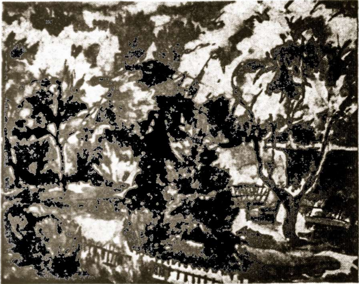
Bronius Murinas —