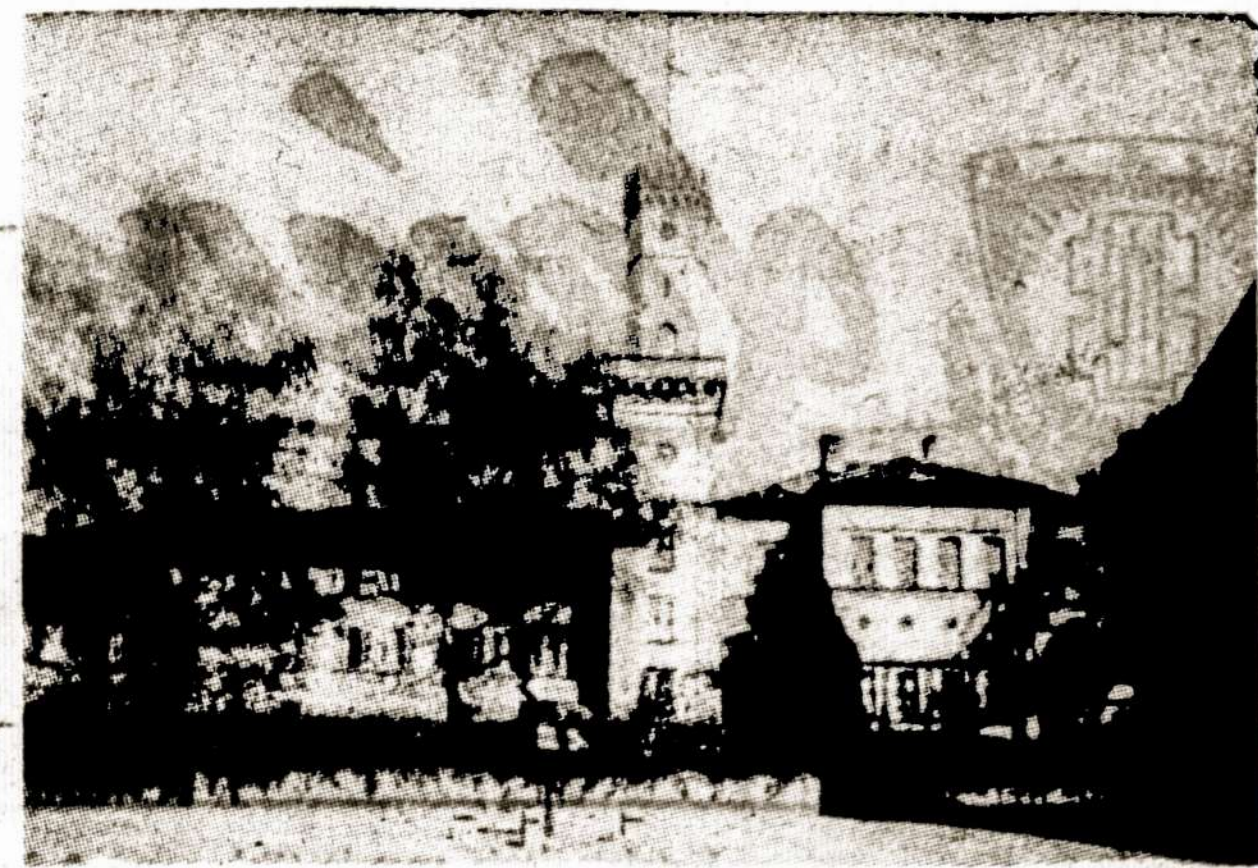
Remkime Vasario 16 Gimnazijos rūmų išsigijimą

— Tik man jau netaušk dar kvalesnių pasakų. Jei su politiku norėjai pasikalbėti, tai kam gi nuomojai ir iš anksto užmokėjai už kambarį su dviem lovom? Ir