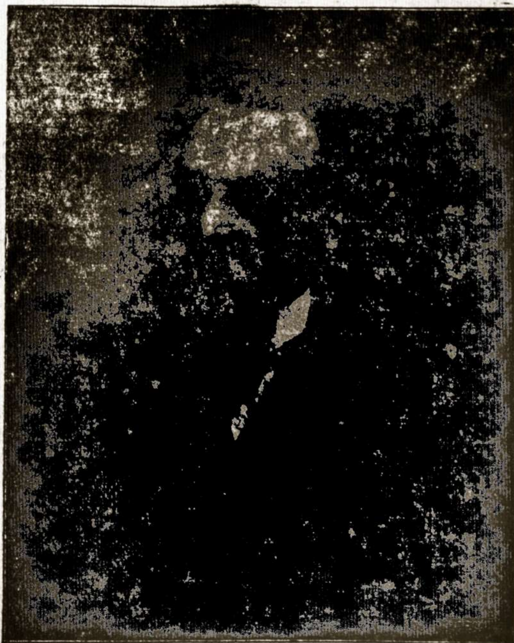
Dr. Jonas Basanavičius — Basanavičius — didžiausias Lietuvos atgimimo žadintojas.

(Kiti laikraščiai ir žurnalai gali išstai arba ištraukas perspaus- dinti. Autorius).