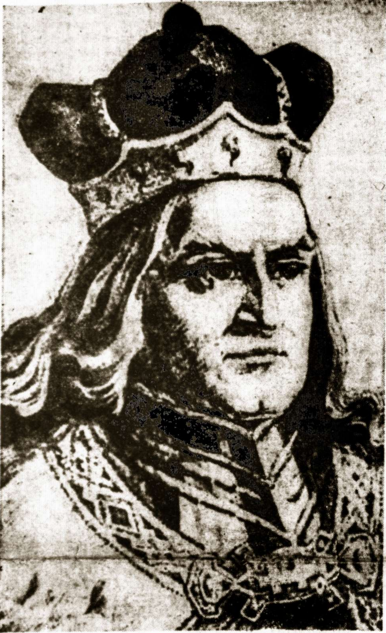
Didysis Lietuvos Kunigaikštis Vytautas — Lietuvos galybė