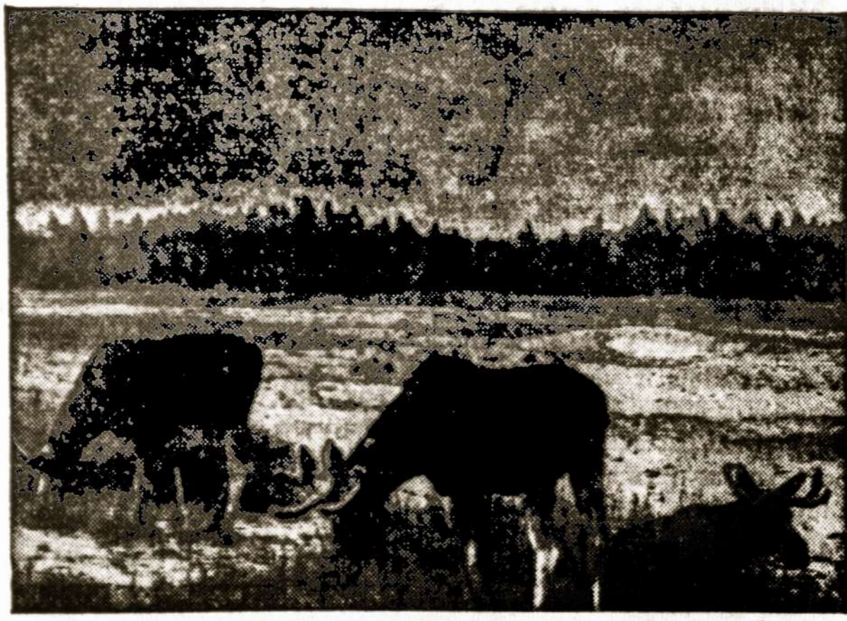
Elniai sotūs ir skurdžiose ganyklose