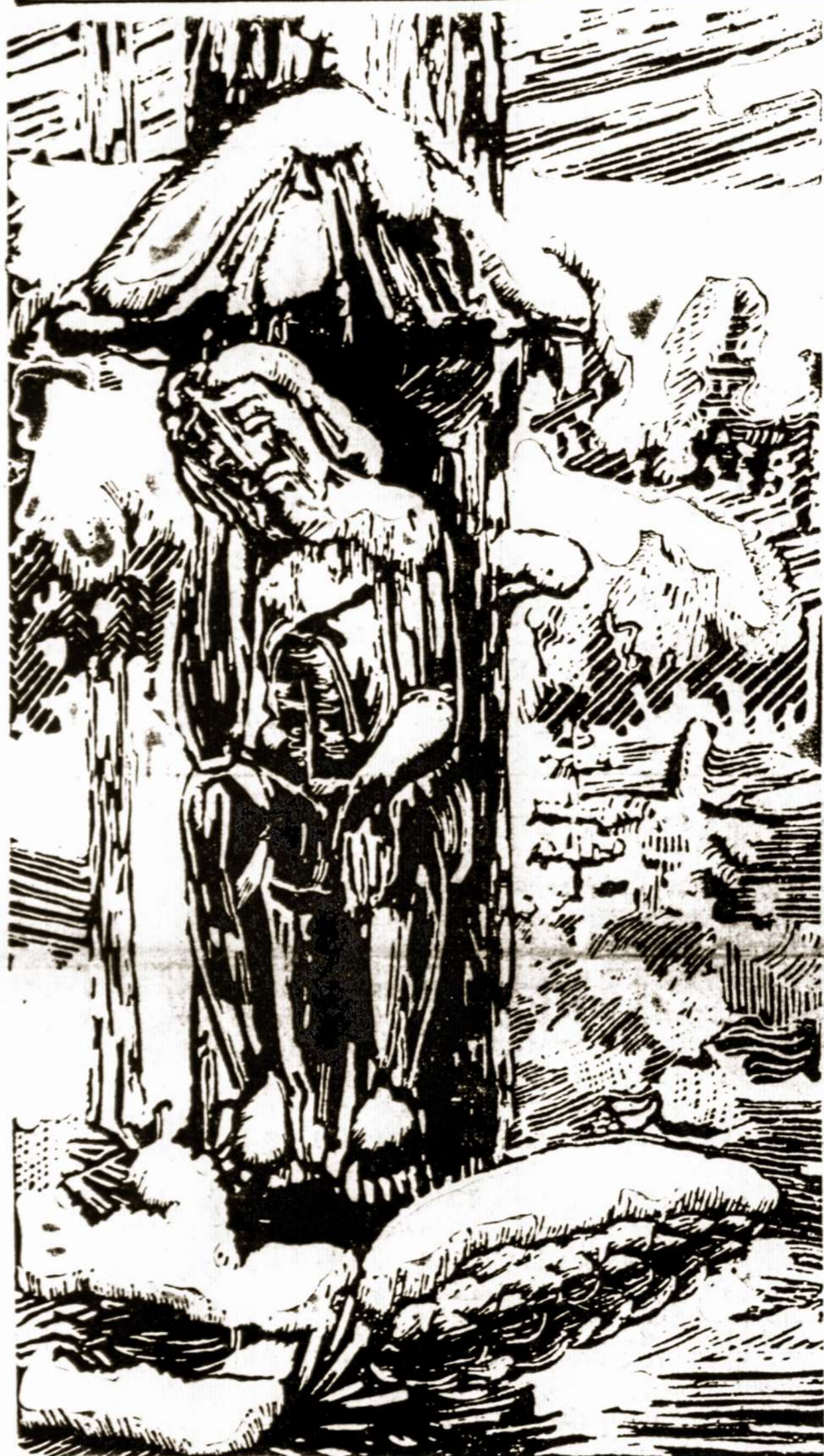
Kalėdos pavergtoje Lietuvoje