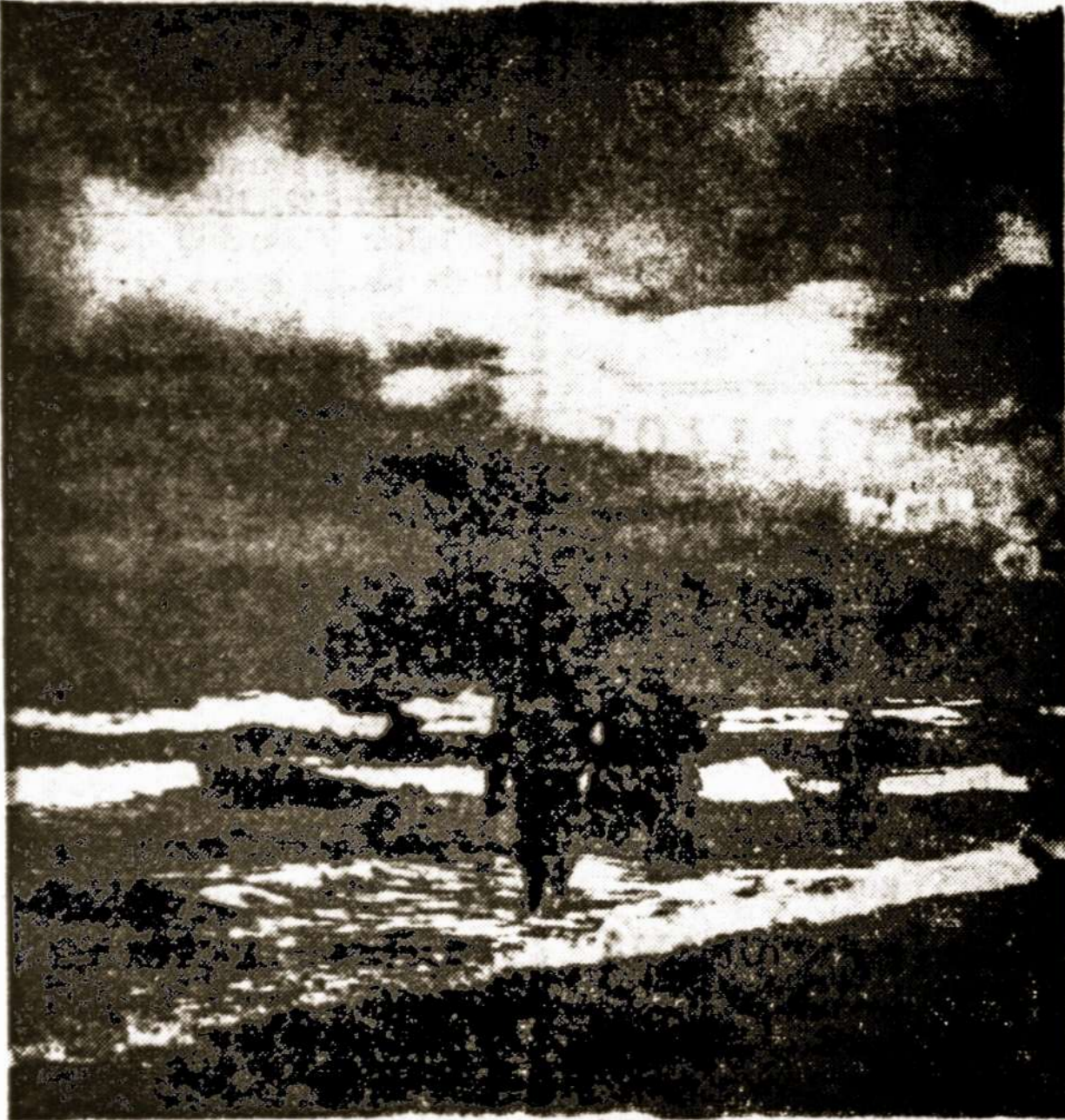
Gintaro žvejybos Lietuvos pajūry

— ABN susiorganizavo Europoje jau prieš 11 metų, ir šiuo metu turi savo skyrius daugelyje valstybių. Neseniai įsisteigė skyriai Prancūzijoje ir Italijoje.