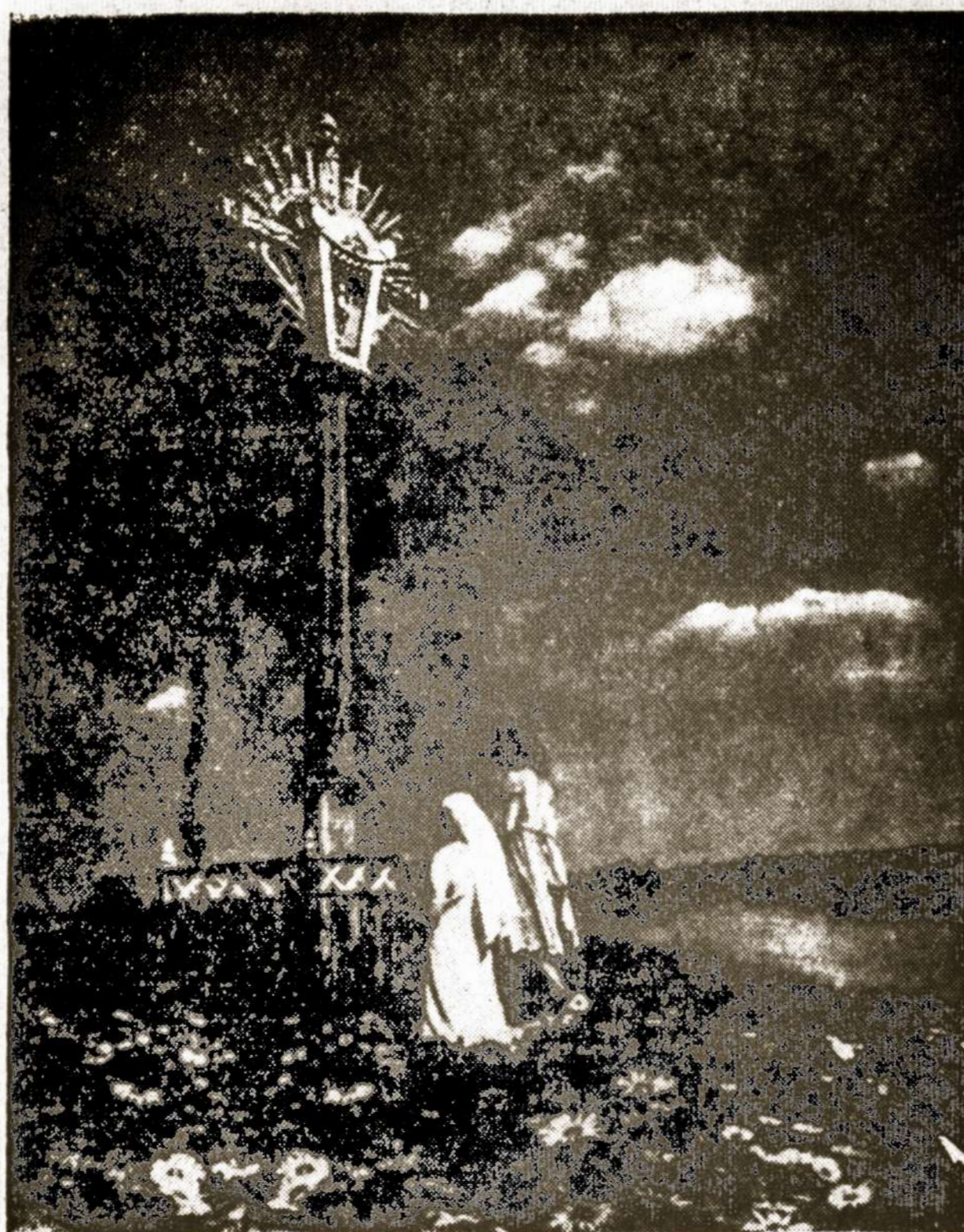
Vakaro malda prie kryžiaus