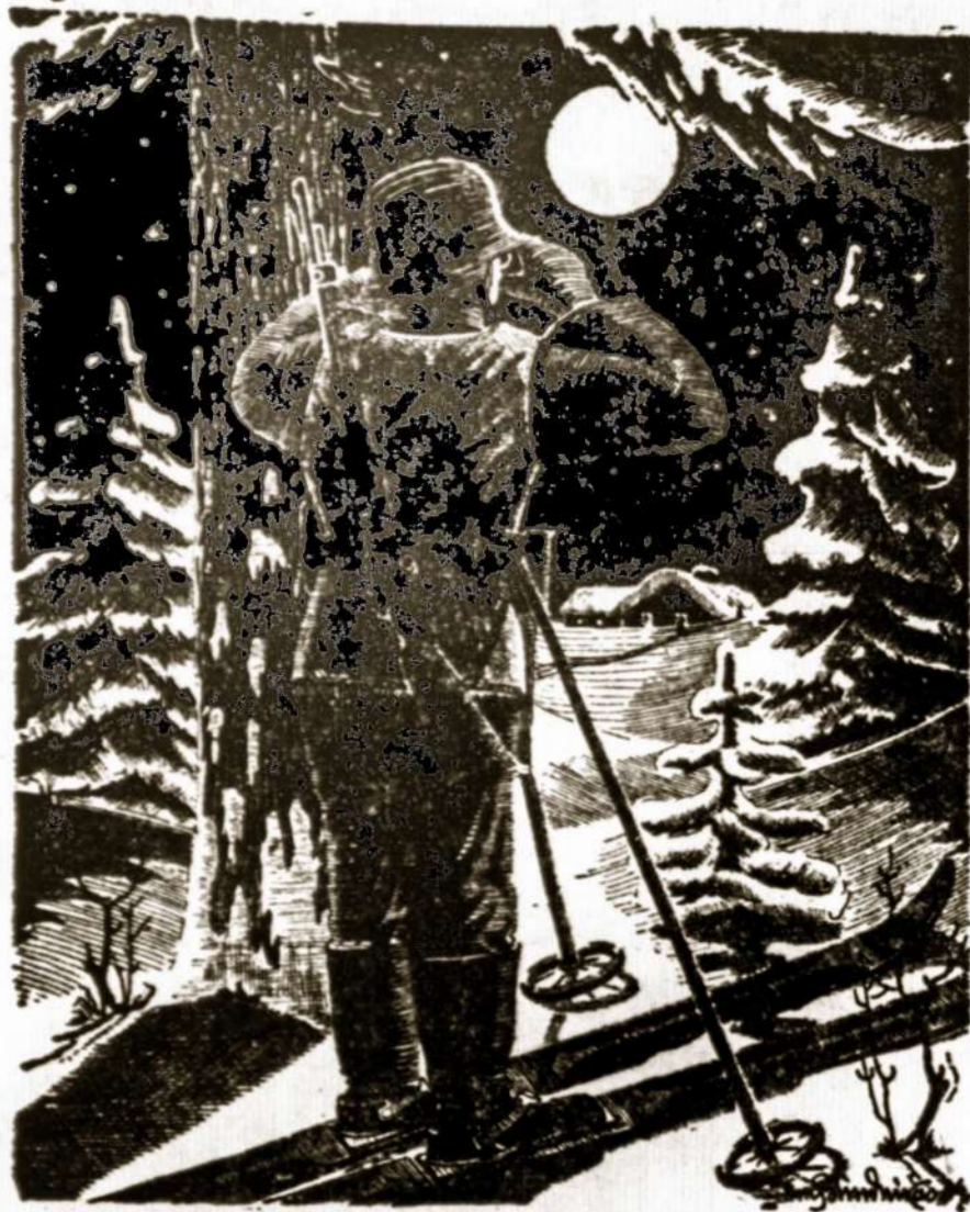
Kūčių naktį tėviškės sargyboje...