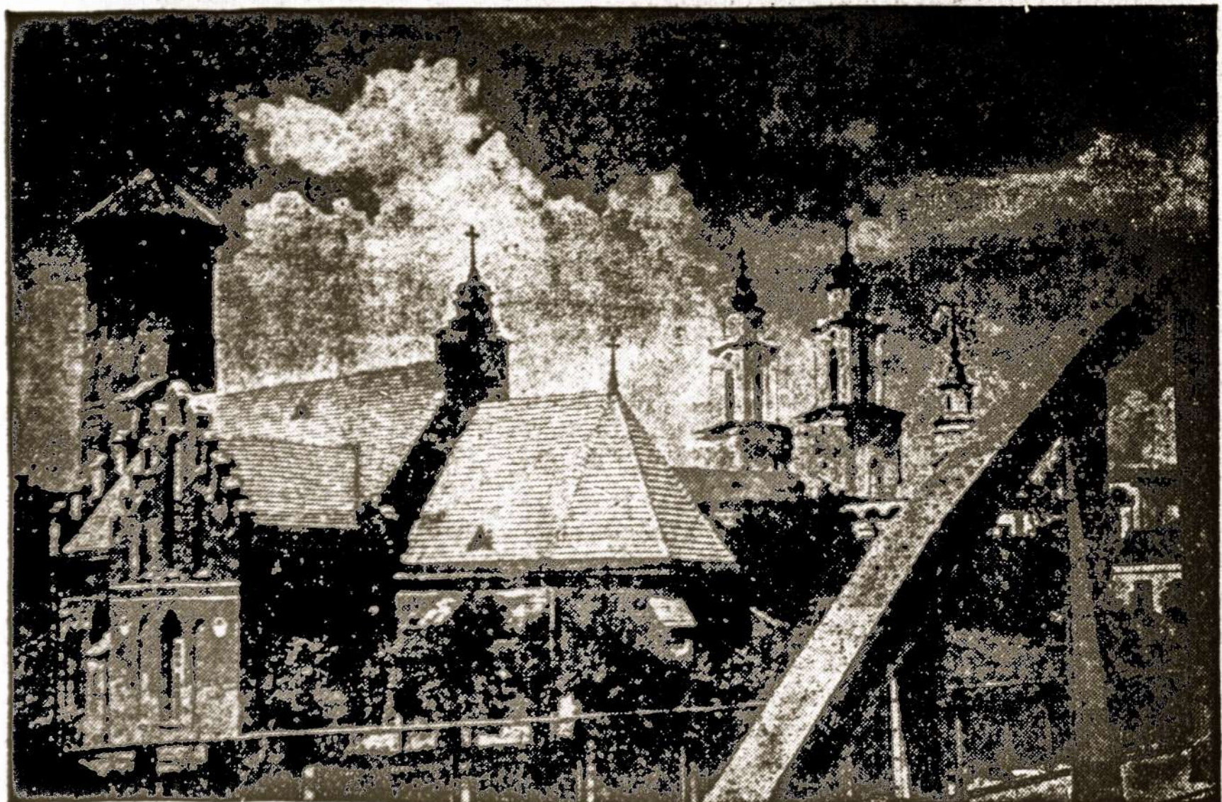
Vytauto Didžiojo Bažnyčia Kaune.

Šventų Kalėdų ir Naujųjų Metų proga sveikinu kūrėjus savanorius, karo invalidus, lietuvius karius bei visus lietuvius ir linkiu išvėmės, valios ir ryžto Lietuvos išlaisvinimo darbe —