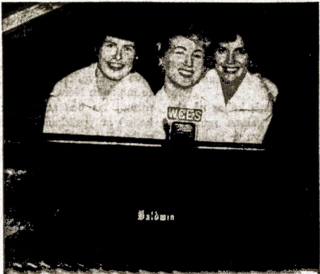
Trys meilytės — trys dainuojančios gražuolės!

Klausykite kas antradienį, 8 val. vakaro, per P. Šaltimero radio: