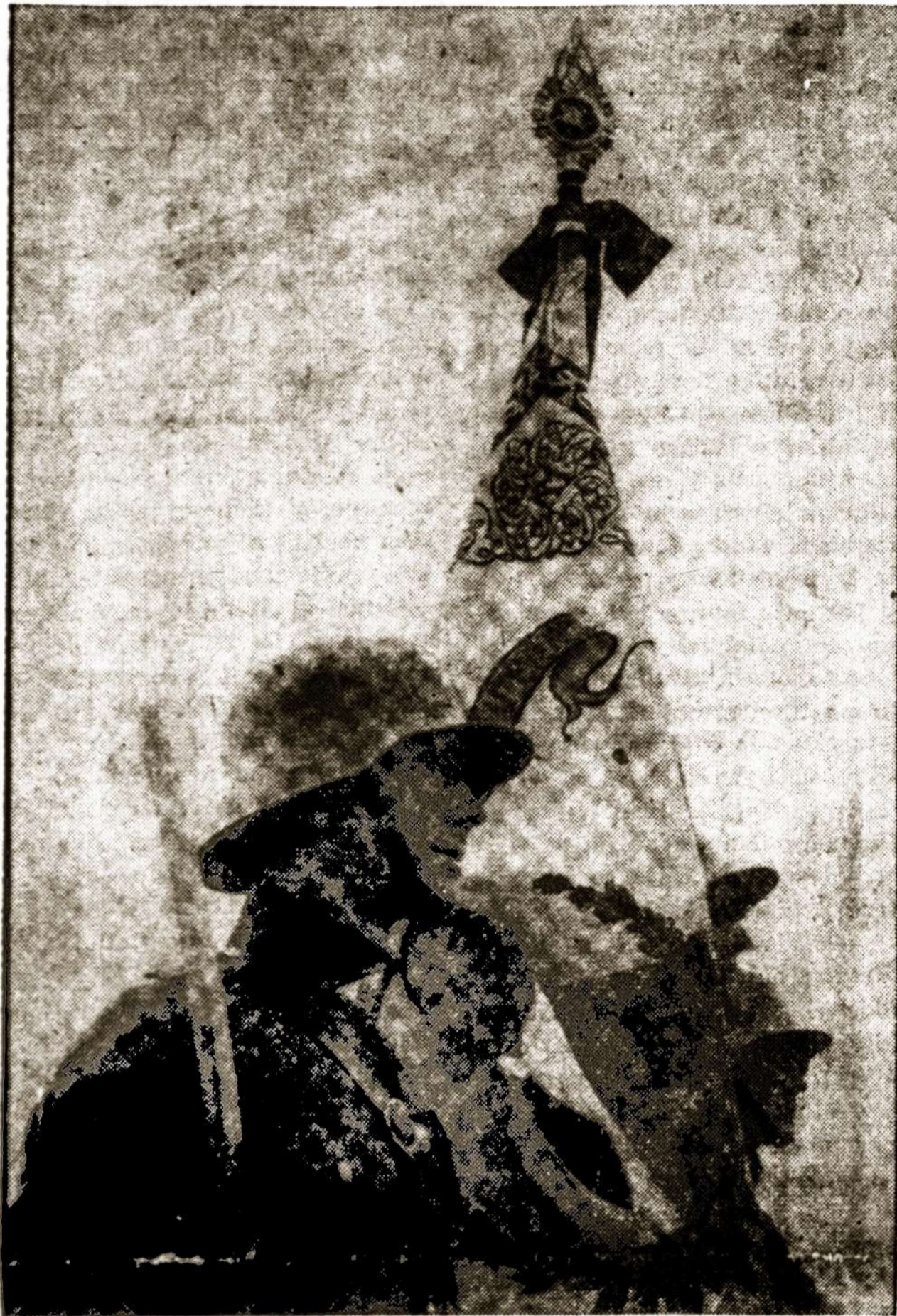
Garbės sargyboje: prie Karo Mokyklos vėliavos...