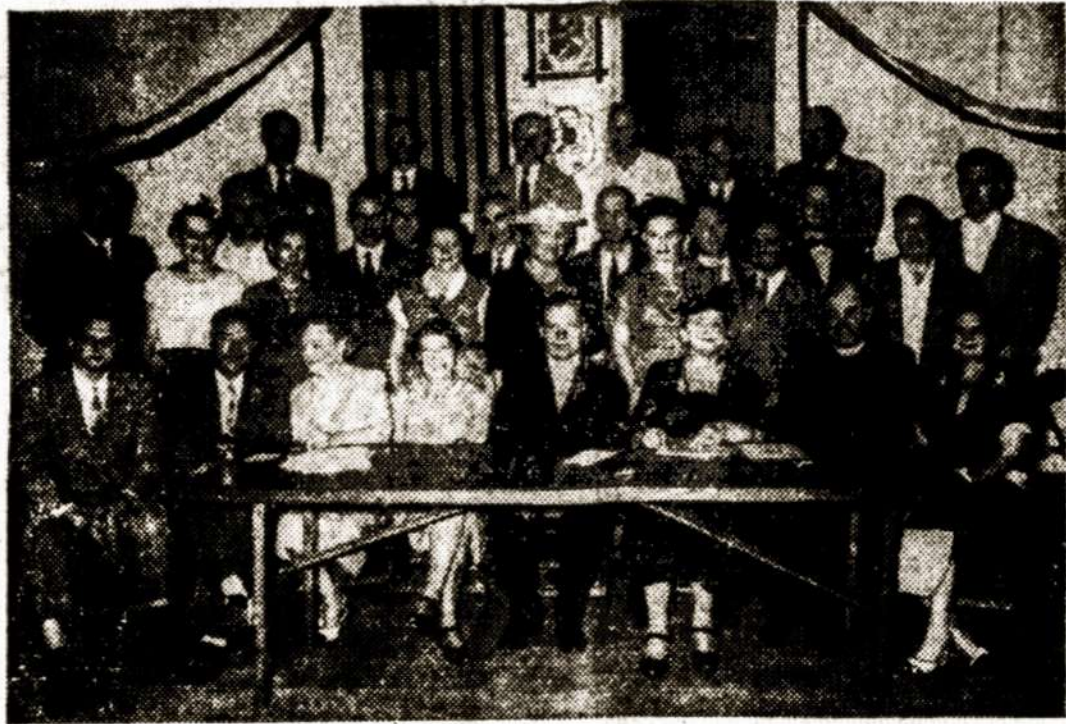
BALFO Talkos Kokieto pirmoje posėdžio dalyviai.