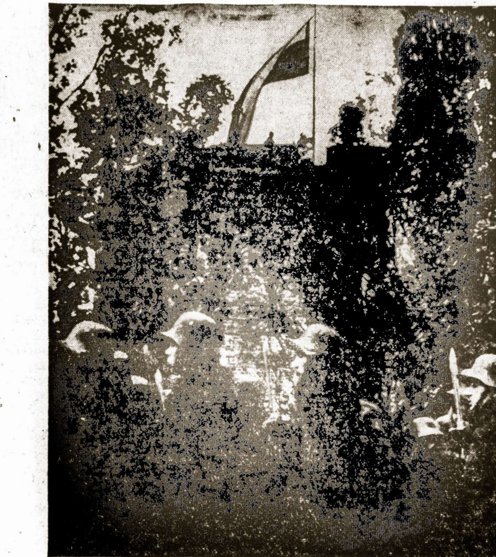
Šitaip Lietuvos kareiviai gerbda vo savo vėliavą