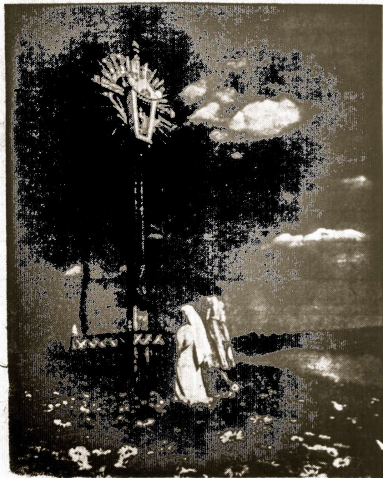
Lietuvaitės meldžiasi vakare prieblandoje.

O. B. Audronė — "BERŽŲ PASAKOS", 1952, spaudos darbus atliko PATRIA, bet kieno leidinys — neaišku, 100 psl. su 70 eilėraščių gerame popieriuje, kaina $ 1.50.