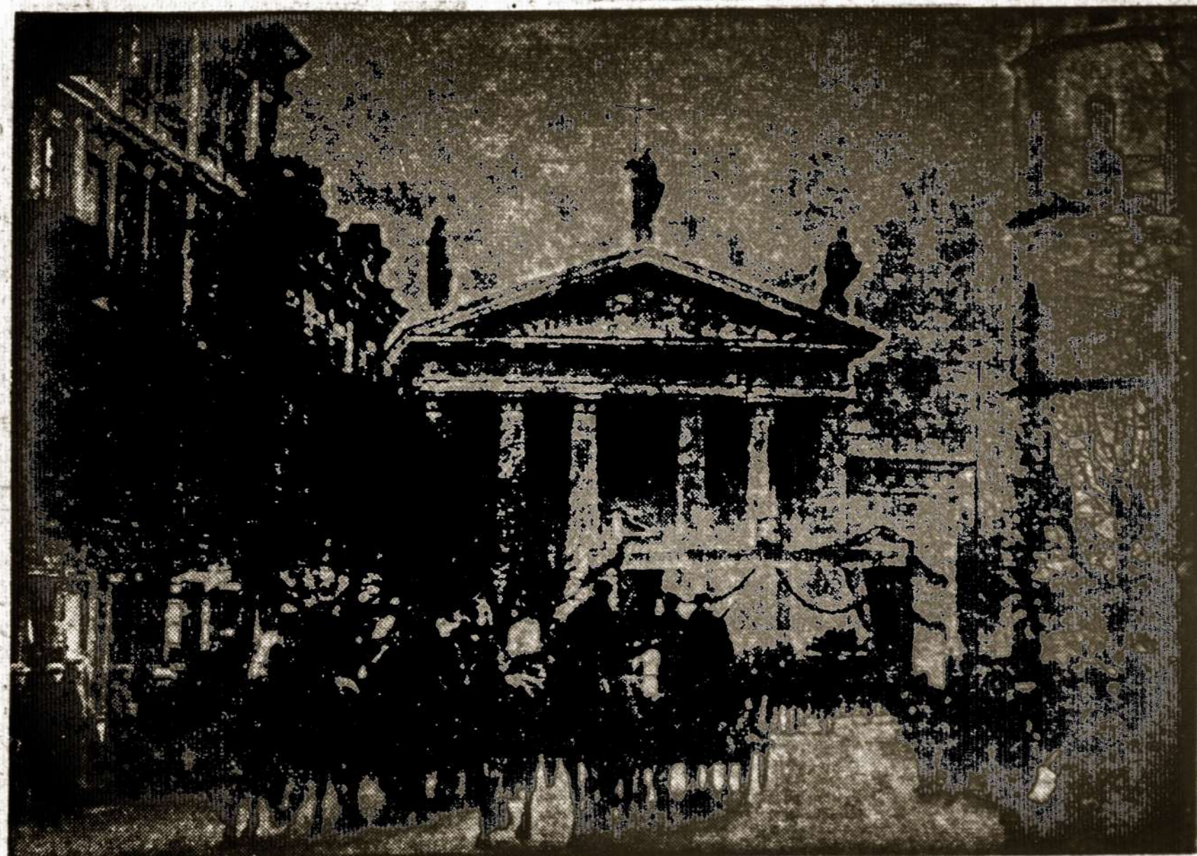
Lietuvos kariuomenė žygiuoja pro Vilniaus Katedrą.

Praeito numerio pirmam pus- lapy tipės straipsnelis "Apie Gu- atemalą" nepriklausė J. Volde- maro apžvalgai. Jis turėjo būti atspausdintas atskirai. Red.