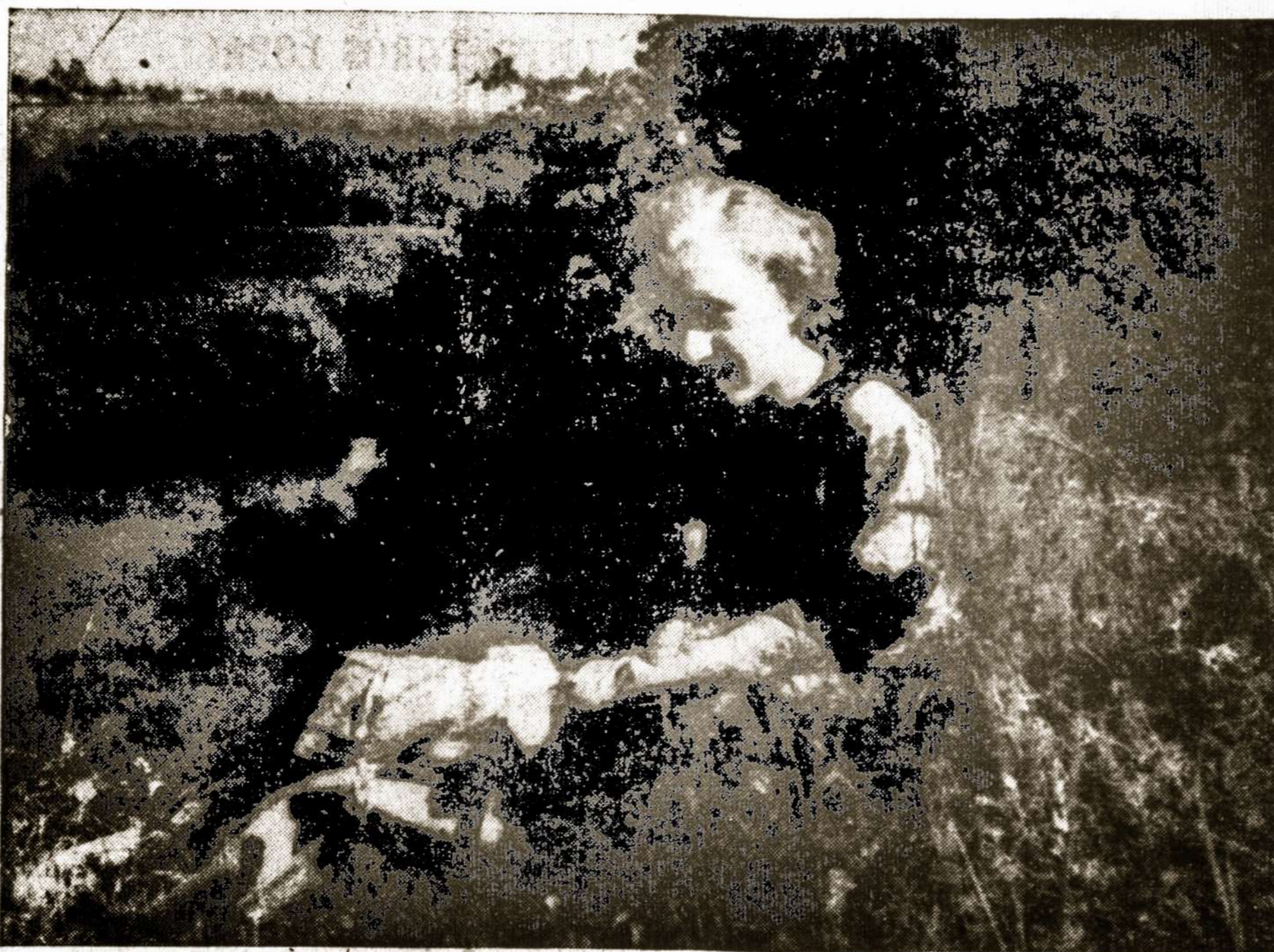
Ant Jėsiós (prie Kauno) kranto

"Būkite geri žmonės ir būkite geri lietuviai"