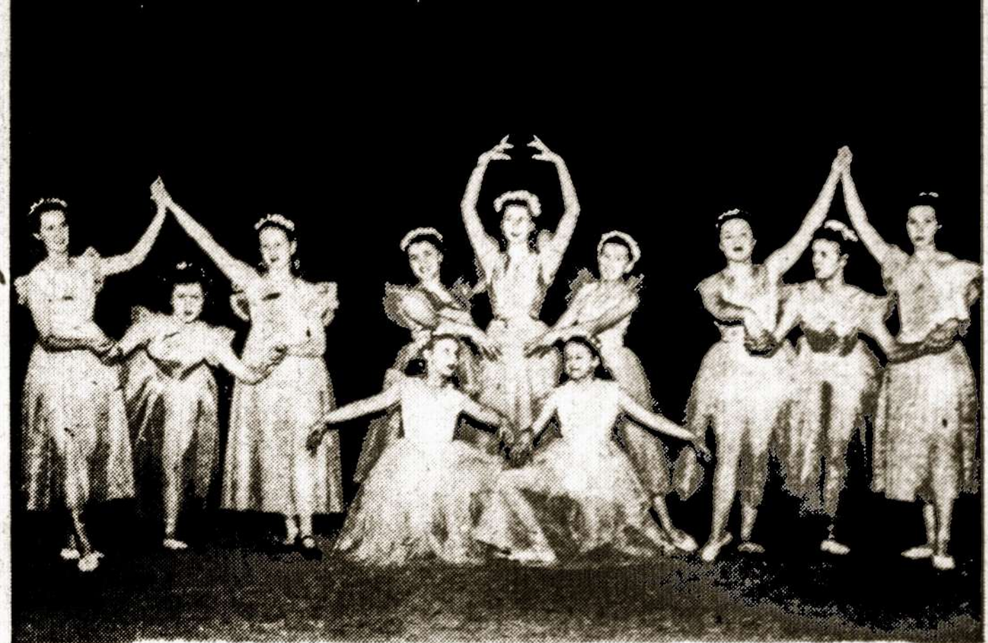
Š. M. GEGUŽĖS MĒN. 15 D. TORONTE, MASARIK HALL, 112 COWAN ST. (kampas Queen St. W.)