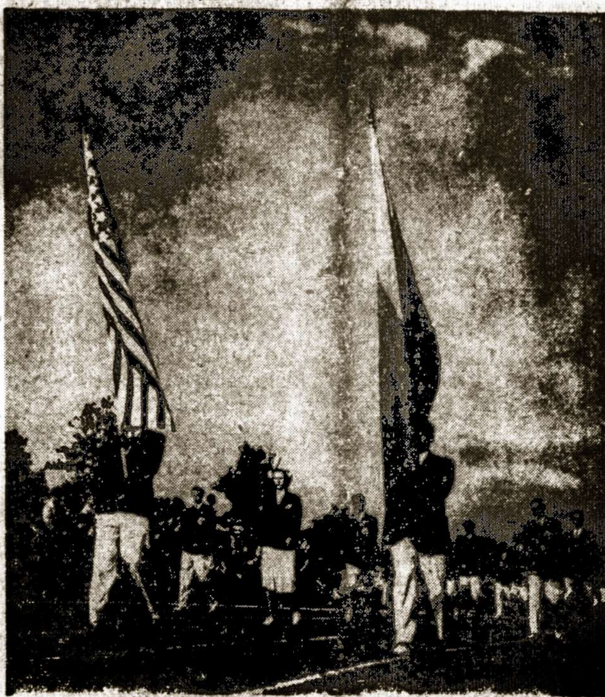
Amerikos lietuviai sportininkai Sperto Olimpiadoj Kaune, 1938 metais.

Taip ir lūkuriojama vėl, kol bus išvartyti iš šventyklų pirkiai, sugražinti iš džunglių savosna pa- rapijosna misijonieriai bei kol bus nuversti supuvę karaliai, kad iš naujo dėl revoliucionierių nuož- mumo aimanuoti pradėjus. O ai- manuosime tikrai, jei laiku sausa lietuvybės šaka buvę nesiliausi- me, jei laiku ne tik gėriu nesula- posime, bet ir gražiausiais žmo- niškumo žiedais nepasipuosime.