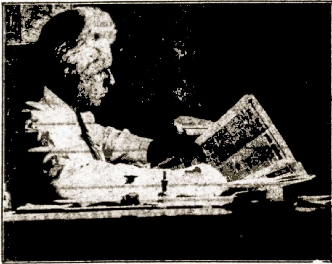
A. Vanagaicio keliu