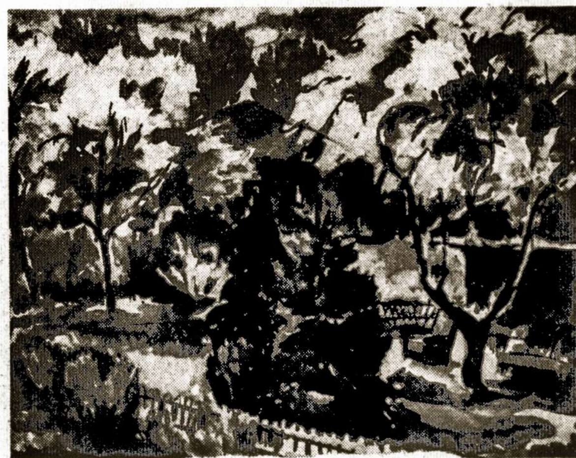
Br. Murlinas — Žydintės obelys.

Vokiečiai pradeda vis labiau ne-rimauti, kad įvairūs didieji vis po-sėdžiauja, o Vokietijos suvienijimo ir ginklavimo klausimas nel iš vie-tos. Yra pavojus, kad Vokietija gal būtų padaryta beginkle ir neutrali. Tai būtų pradžia Vokietijos inkorpo-ravimui i Sovietų sistemą. Kai kas mano, kad Sovietai nori tokios "ka-nos" už jų bendradarbiavimą ato-minėje srityje.