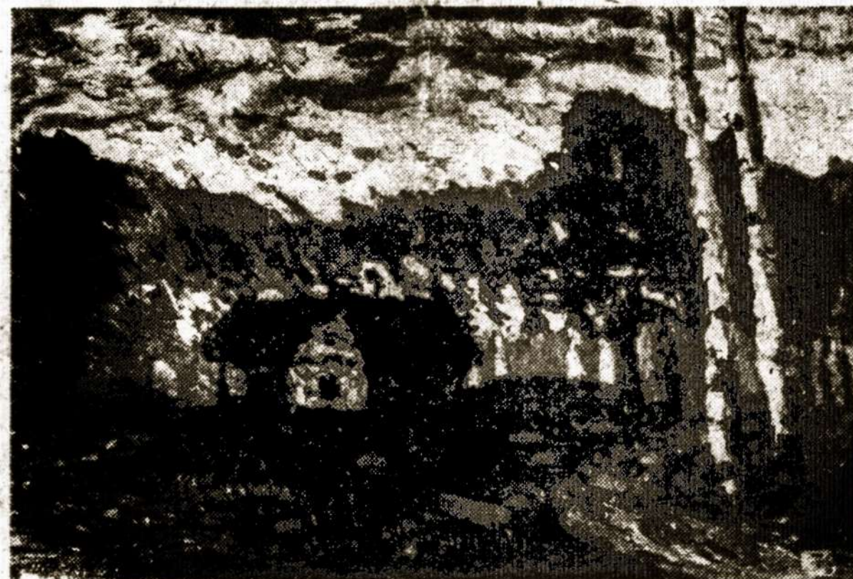
J. Pautientus — Ruduo Lietuvoje.