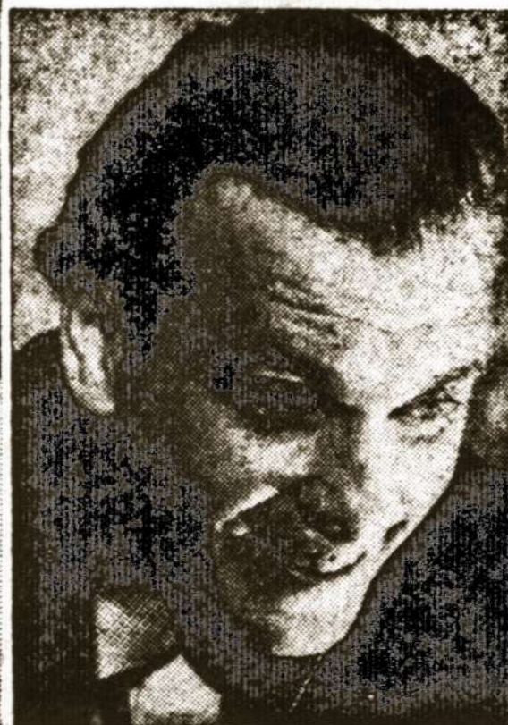
Fats anas — pats tikras