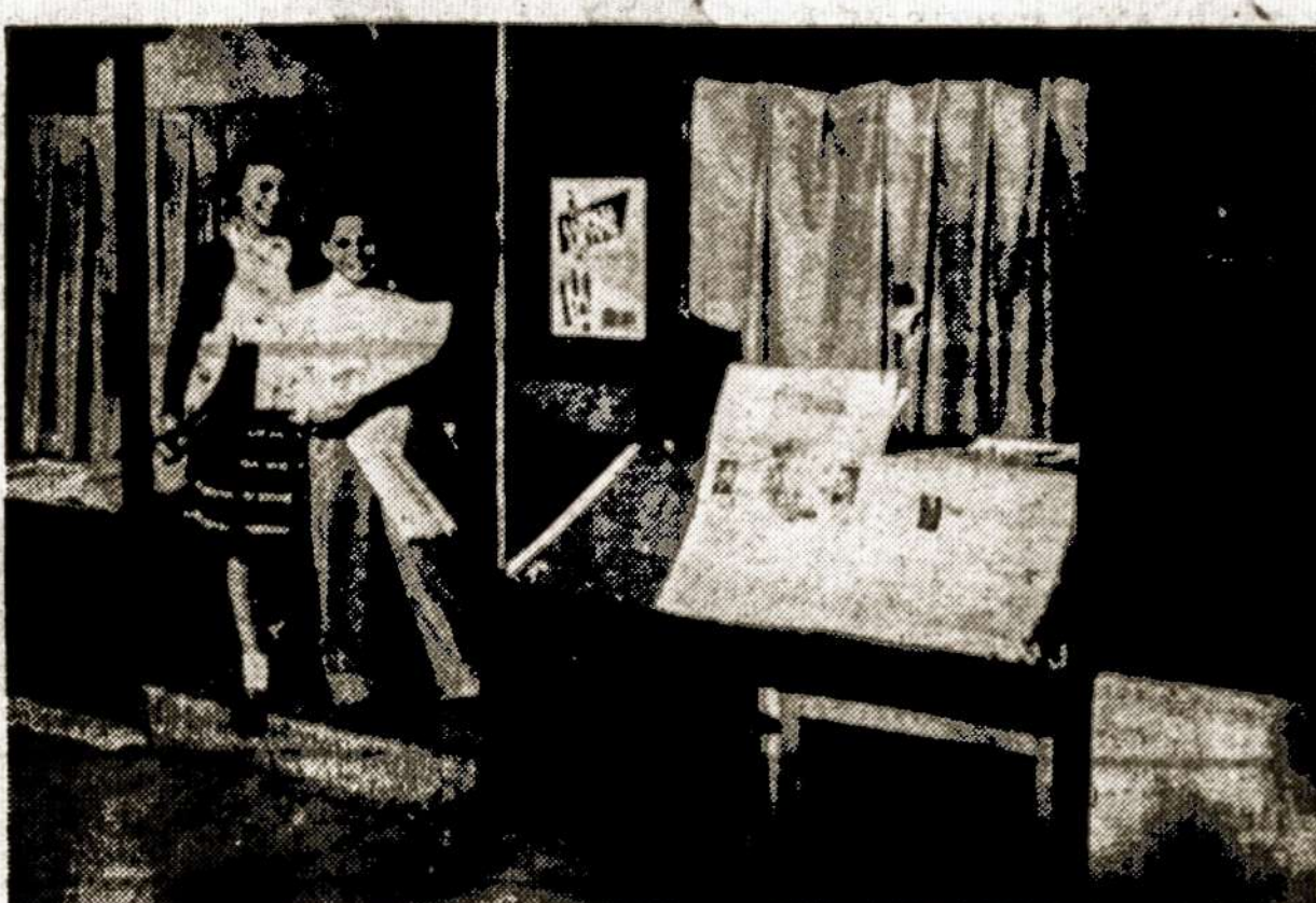
Pirmieji ir jauniausieji „L. L.“ platintojai skuba į darbą.

Brangūs studijos dalyviai, iki pasimatymo, kita kartą.