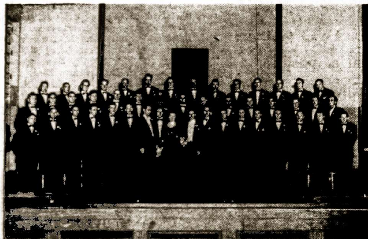
Ten, kur skamba laisvi dainos aidai