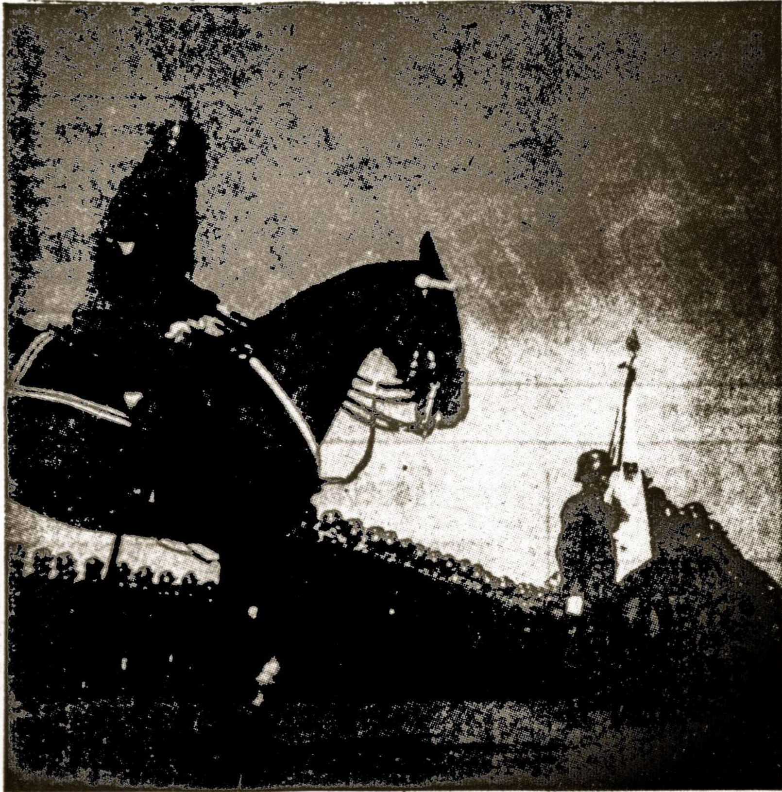
Lietuvos kariuomenės paradas Kaune.