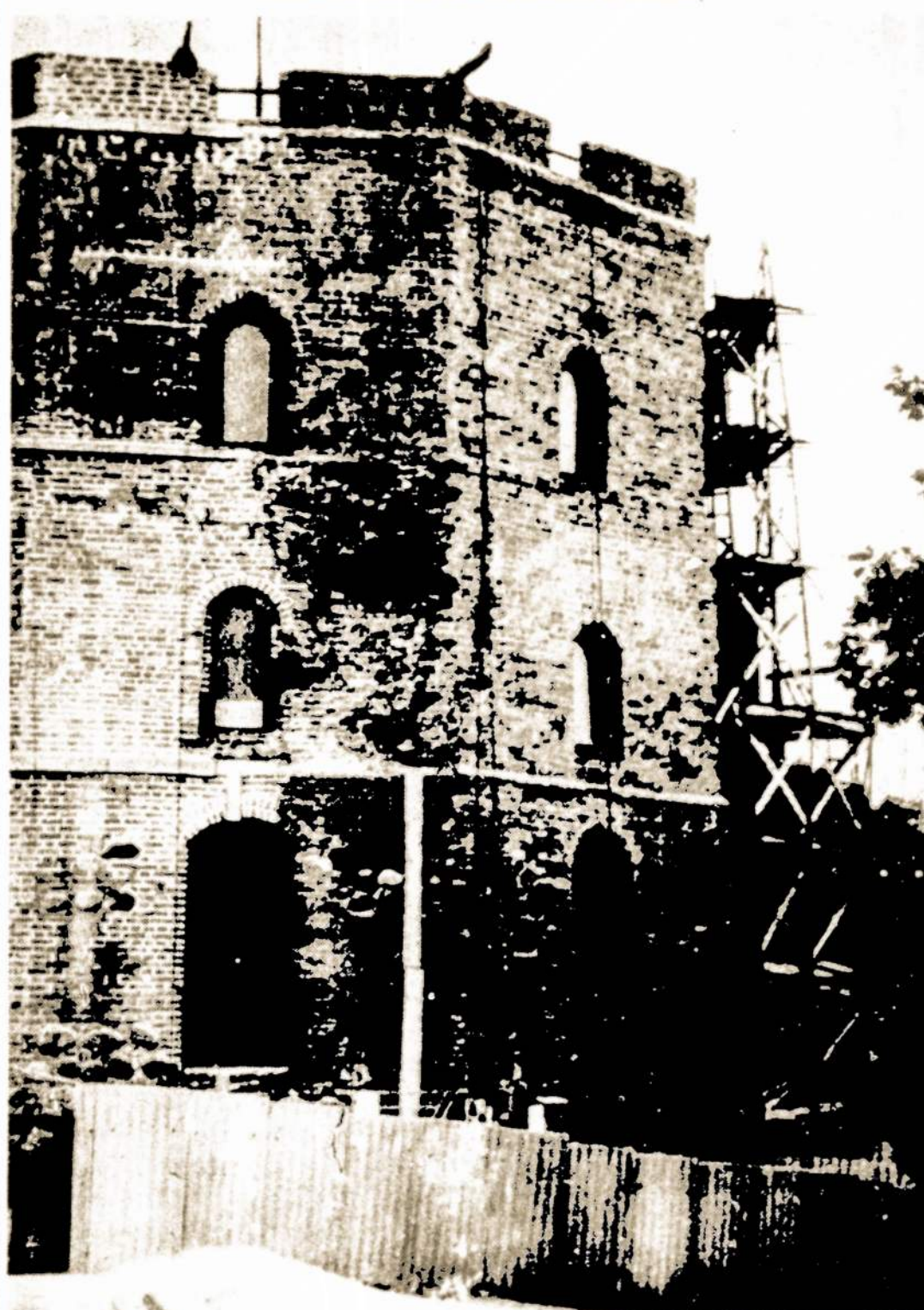
Nuotraukoje: Gedimino Pilies bokštas pastoliuose.

Laikas ir metų laikai negailestingai trupina Sąjunginės reikšmės istorinio-architektūrinio paminklo — Gedimino Pilies — sienas. Todėl šiais metais vasaros pradžioje Vilniaus restauravimo tresto meistrai pradėjo Pilies sienų restauravimo ir konservavimo darbus: keičiamos senos ir sutrupėjusios plytos, taisomos mūro siūlės tarp plytų, raudondvario skarda dengiamos palangės, karnizai. Sekančius metus Pilis pasiitiks atjaunėjusi, pasipuošusi.