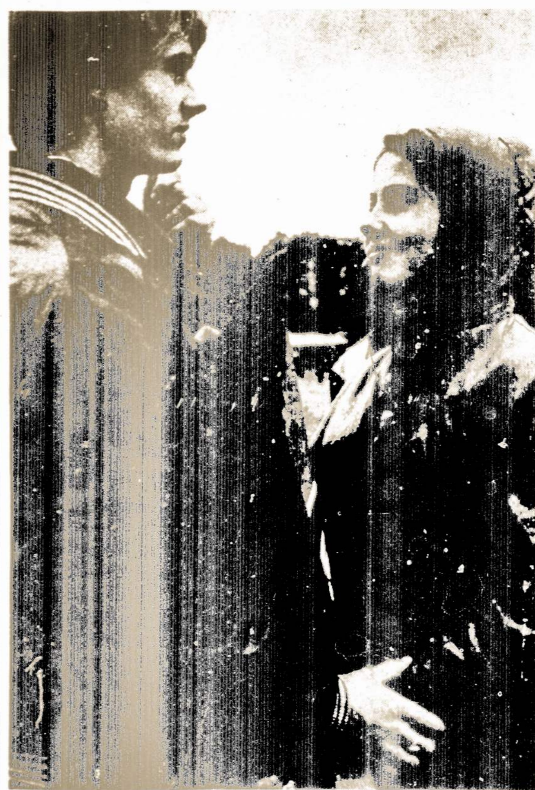
Iš Lietuvos kasdieninio gyvenimo: jauna porėli Vilniuje ir senukai kaime.

Kopenhaga. — 85 balsais prieš 10 Danijos parlamentas nusprendė ipareigoti vyriausybę imtis visų galimų priemonių, kad Vakarų Europoje nebūtų dislokuotos JAV branduolinės raketos.