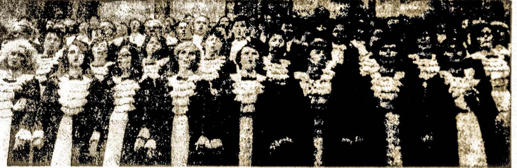
dainuoja jungtinis panevėžiečių choras.