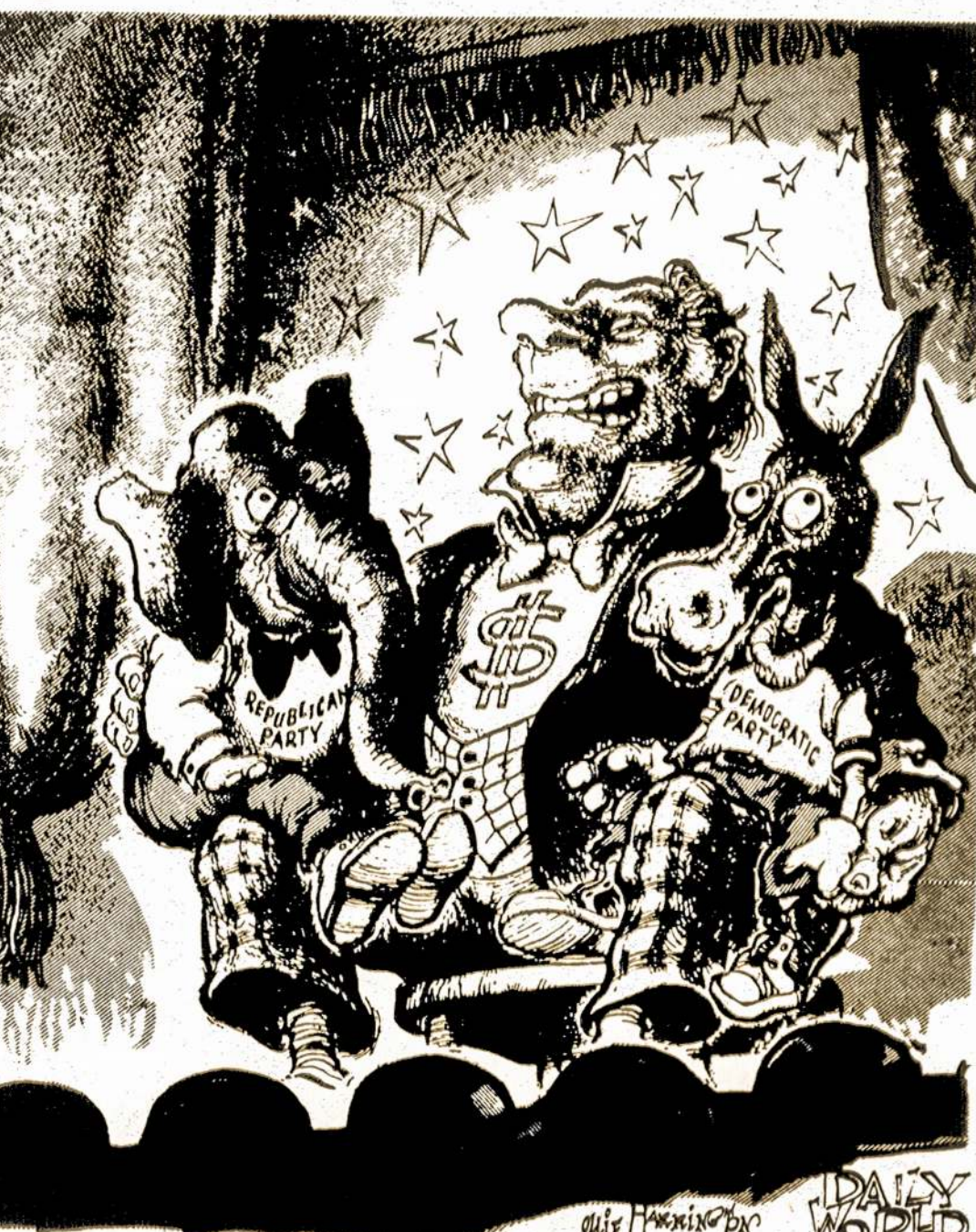
Republikonų Partija ir Demokratų Partija: du veidai, bet tik vienas balsas. Abi lygiai ištikimos kapitalo interesams.

Dailės parodų rūmuose lankytojų akis ir širdis džiugino šimtai įvairiaspalvių žiedų. Įvairių profesijų žmonės savo laisvalaikiais išaugino įvairių įvairiausių žiedų. Geriausieji gėlių augintojai buvo apdovanoti Lietuvos sodininkų draugijos diplomais.