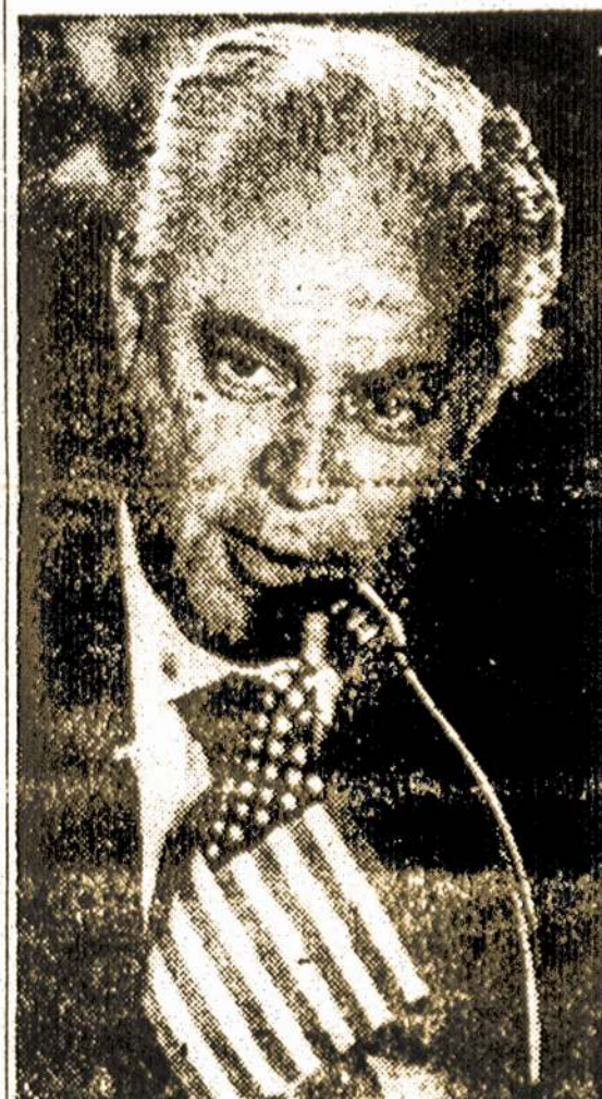
Robert S. Strauss

Alexandria, Egiptas. — Cia jis yra atvykęs kaip prezidento Carter specialus pasiuntinys tarpininkauti Izraelio ir Egipto derybose. Atrodo, jog prez. Carter mano, kad Egipto ir Izraelio atstovai be jo vadovybės bei komandos pasiekti kokio nors susitarimo nepajėgtų.