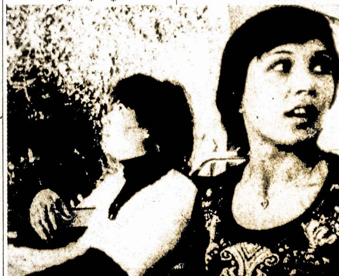
Nelli Kim, Soviet Olympic gymnast [r.] and team Amilla Turischeva enjoy sights at the San Diego Zoo. 21, and five members of the Soviet national gym team performed in San Diego on the last leg of a five U. S. tour.

Charlie and Josephine were llamas who lived at the Lollipop Farm Zoo in Rochester. Josephine, who had been healthy until Charlie's sudden demise, apparently died of a broken heart, a phenomenon well known in poetry and folklore but rarely acknowledged by modern medicine. [The N. Y. Times] Ise