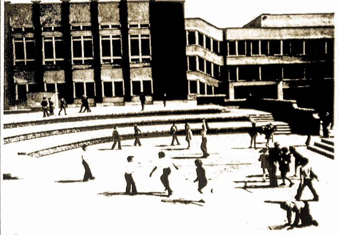
Nuotraukoje: Vidurinė mokykla, pastatyta pagal kauniečių architektės D. Greblikienės projektą.

Pagal kauniečių architektų paruoštus projektus dabar čia statomi prekybos centras, paštas ir telegrafas, kiti visuomeniniai pastatai. O institute dirbtuvėse užbaigti būsimųjų liginės komplekso, plaukiojimo baseino projektai.