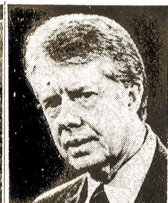
Prez. Jimmy Carter

Tai gana prezidento Carterio staigus ir svarbus šios šalies nusistatymo pakeitimas. Aišku, kad jis sudomino visą pasaulį. Ne visur jis yra vienodai sutinkamas — vienuer sveikinamas, kitur kritikuojamas. Jis yra įvairiai sutinkamas ir šioje šalyje. Pavyzdžiui, kai buvę prezidentai republikonai Nixonas ir Fordas įsteigimą diplomatinis ryšių su Kinija pilnai