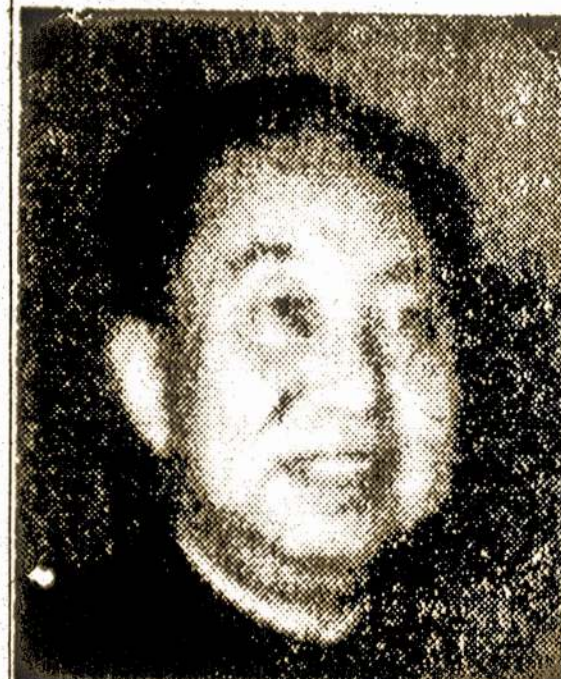
Premj. Hua Kuofeng

Gruodžio 15 dienos vakare tuo pačiu laiku Washingtono prezidentas Jimmy Carteris, o Pekine premjeras Hua Kuofeng per radiją ir televiziją paskaitė tą patį pranešimą, kuriame sakoma, kad Jungtinės Valstijos ir Kinijos Liaudies Respublika nutarė su ateinančių metų sausio 1 diena įsteigti diplomatinis ryšius. Tame pačiame pranešime taipgi sakoma, kad Jungtinės Valstijos nutrauks diplomatinis ryšius su taip vadinama Chiang Kai-šek klijos Formozos (Taivano) saloje įsteigta Tautine Kinija, kurią, kaip žinia, ši šalis visą laiką laikė tikrąja Kinija, visos kinų tautos ir t. t. atstove.