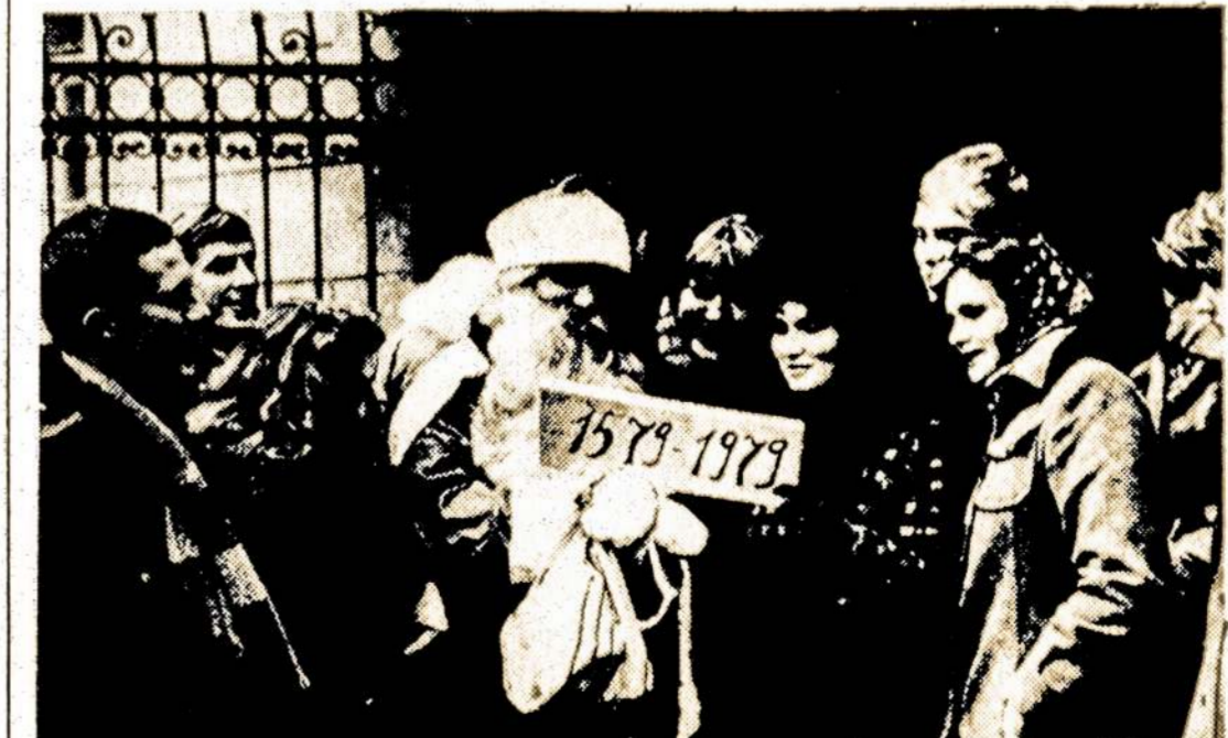
Nuaidės naujametiniai kurantai, ir Vilniaus Valstybinis V. Kapsuko universitetas pradės skaičiuoti 400-uosius savo istorijos metus. Sveikinimai artėjančio jubiliejaus proga jau dabar plaukia iš visų Žemės kampelių.

Iš būsimų individualių pastatų reikia pažymėti "Klaipėdos" viešbutį, kuris galutinai