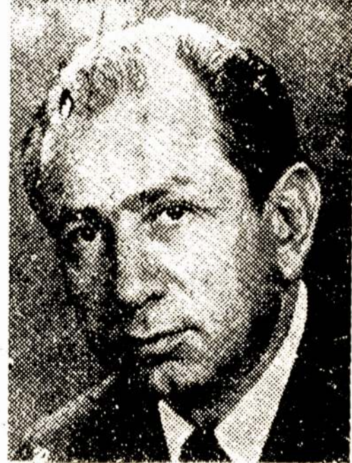
Rabbi Joachim Prinz

Plačiai veikianti Amerikos žydų organizacija "Breira" pasiutė atvirą laišką Izraelio vyriausybei, kuriame protestuojama prieš jos politiką santykiuose su arabais. Laiškas taip pat reikalaujama, kad Izraelis stengtųsi susitaikyti su arabais, ypač palestiniečiais, pripažįstant jiems jų teisę į savo tautinę nepriklausomybę ir valstybę.