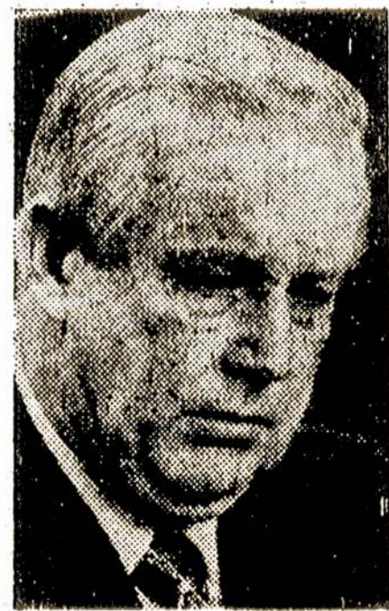
Gub. Arch. A. More Jr.

Charleston, W. Va. — West Virginijos gubernatoriui atsidūrė federaliniame teisme. Jis kaltinamas emime kyšių už tam tikrus "patarnavimus".