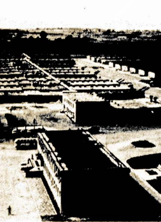
Dabar kiekvieną dieną iš Vievio paukštyno į Vilniaus, Kauno, kitų miestų parduotuves išsiunčiama po 350-300 tūkstančių kiaušinių ir tris tonas paukštienos.

Maskvoje nuo minėtos aikštės. Tas žiedas įgalina auto mašinas vystyti didžiulį greitį ir trafiko nestabdą jo- kios šviesos. Tokių žiedų mieste esama ir daugiau.