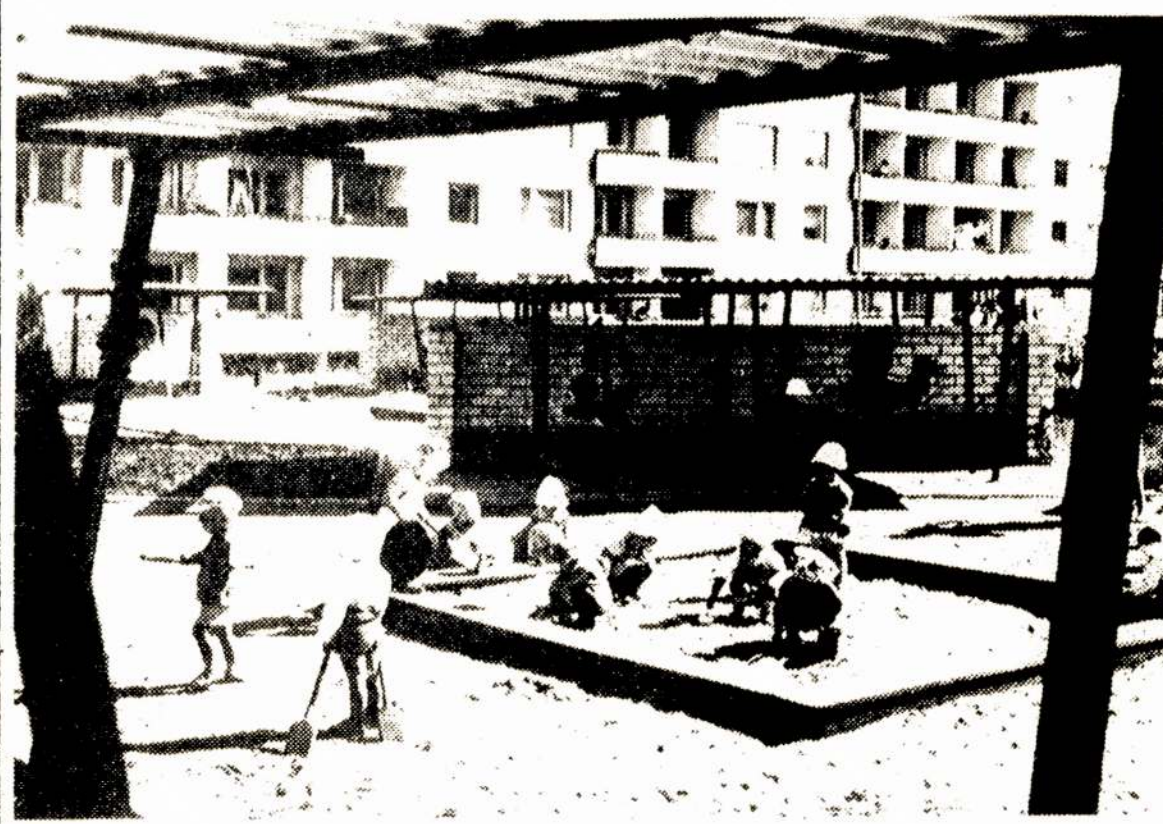
Utena. Vaikų darželis naujajame Dauniškio rajone.