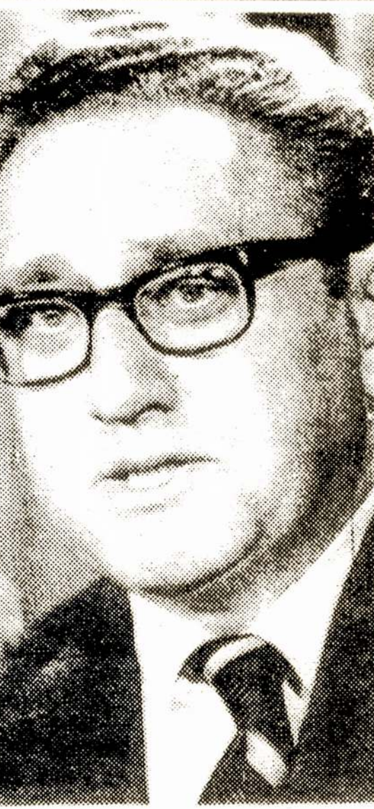
Henry A. Kissinger