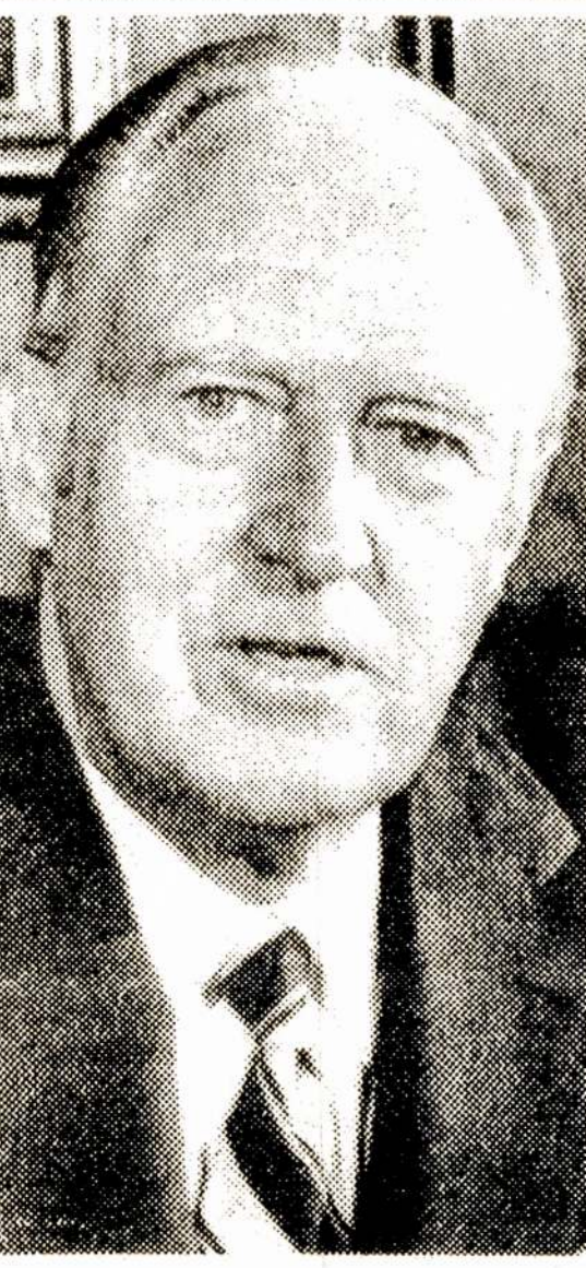
William P. Rogers

Maskva. Spauda rašo, kad šiemet Tarybų Sąjungoje užderėjo geras derlius, nors pietuose lietus nemažai pakenkė. Ukrainoje jau nuimtas derlius. Zaporozėje gauta pusantro milijono tonų grūdų arba 40% virš plano.