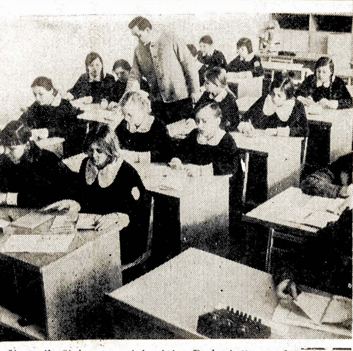
Šie vaikučiai — naujakuriai. Rudenį jie pradėjo lankyti naują Alytaus vidurinę mokyklą. Joje mokina 1,320 vaikų.

Washingtonas. — Gegužės 8 d. Nixonas įsakė užminuoti visą Šiaurės Vietnamo vandens pakraštį, kad Tarybų Sąjungos ir kitų socialistinių šalių laivai su parama nebegalėtų ten atplaukti. Jis kartu įsakė bombarduoti Šiaurės Vietnamo geležinkelius, kad negalėtų pristatyti karinių reikmenų. Tuo dekretu prez. Nixonas žymiai praplėte karą. Jis pasiuntė ultimatumą Š. Vietnamui, kad sulaukytų kariavimą, paleistų amerikiečius karo belaisvius ir tt. Reiškia, Nixonas norėtų, kad Vietnamo kovojančios liaudies jėgos nustotų priešintis ir pasiduotų Amerikos imperialistams. Vietnamo laudies jėgos griežtai pasmerkė Nixono ultimatumą ir pasiryžo tęsti kovą prieš agresorius. Nixonas nutraukė Vietnamo taikos pasitarimus Paryžiuje. Abi Vietnamo delegacijos pasmerkė Nixono karinį diktatą. Panaikino kontrolę mažajam bizniui Washingtonas. — Gyvenimo Kainų taryba paskelbė, kad panaikinama kontrolė mažajam bizniui, turinčiam 60 ar mažiau samdinių. Šis patvarkymas apima 5 milijonus mažųjų įstaigų su 19 milijonų darbininkų. New Delhis. — Indija jau ruošia atominės bombos išbandymą greitoje ateityje.