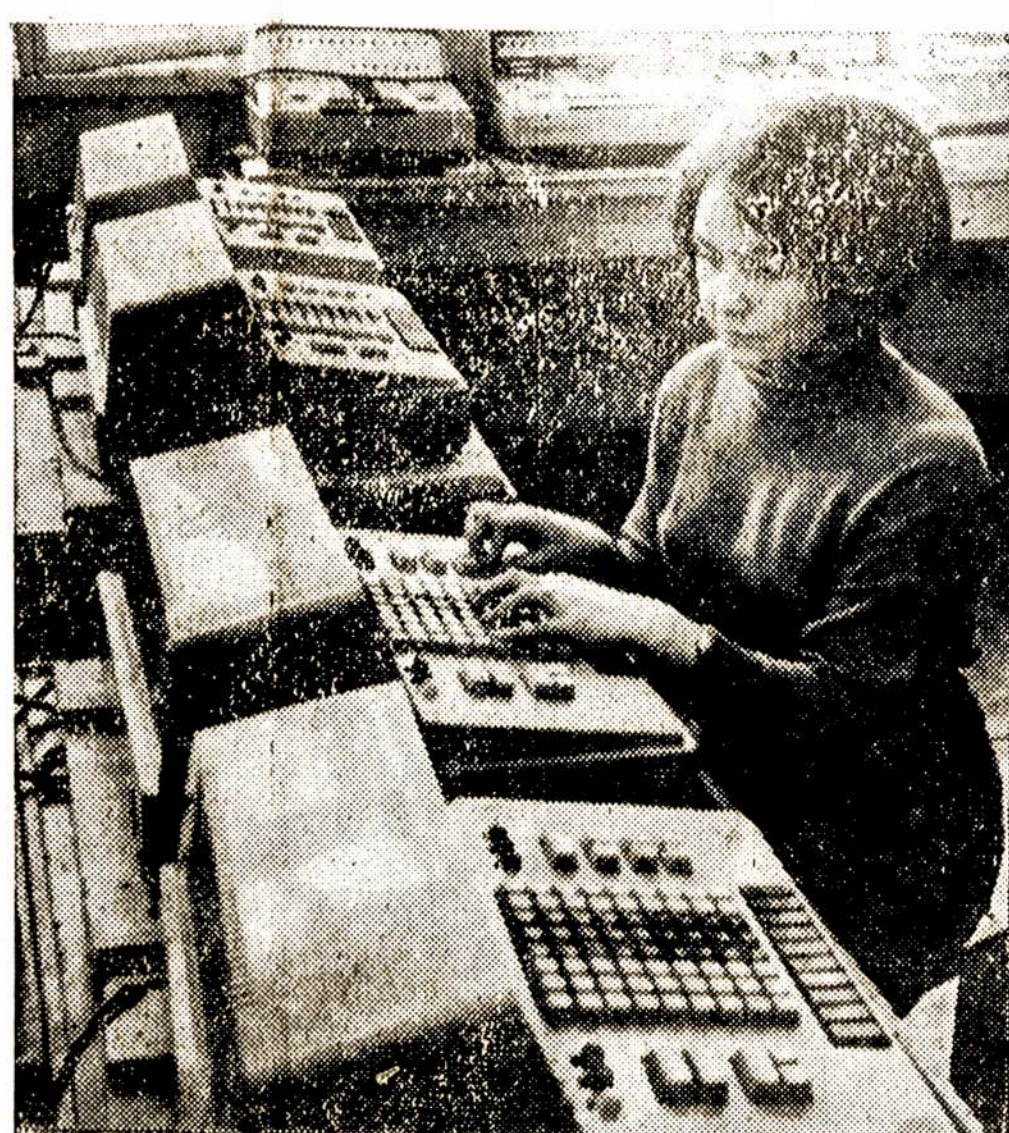
Skaičiavimo mašinos "Vilnius" plačiai naudojamos buhalterinei apskaitai.

Lagos.— Nigerijos sostinės uoste lankėsi du Tarybų Sąjungos kariniai laivai.