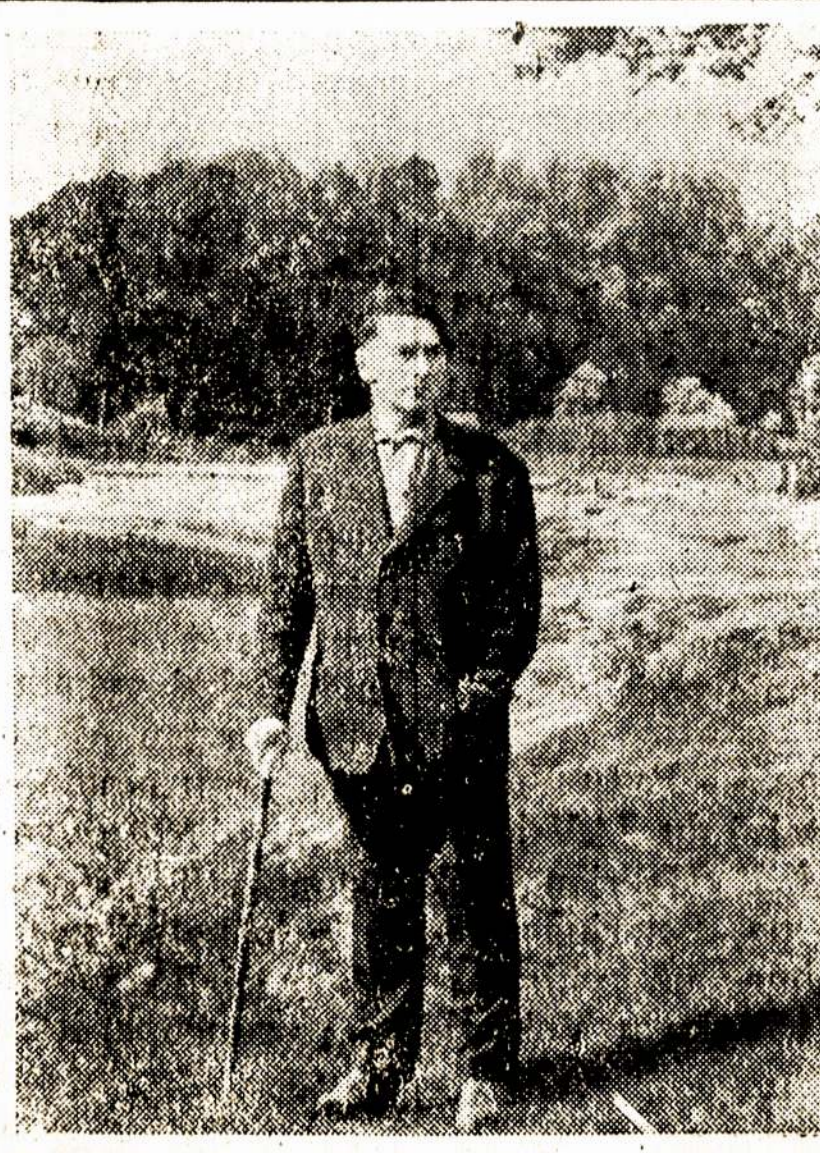
Rašytojas Jonas Šimkus. Viena paskutiniųjų jo nuotraukų. Fotografuota Vilniuje, Valakampiuose, kur paskutiniu metu poilsiaudavo rašytojas.