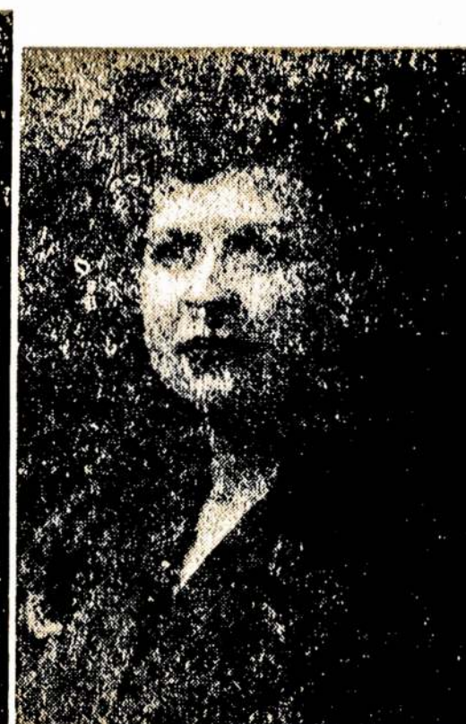
Ona Dirvelienė sopranas