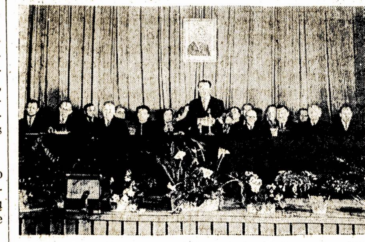
Vilniaus Valstybinio V. Kapsuko vardo universiteto garbės daktaro A. Bimbos 70-ųjų gimimo metų minėjimas Universiteto akty salėje.

Biuro įstaigose akys bus tikrinamos veltui, taipgi ir privatių daktarų paludymai bus skaitomi gerai.