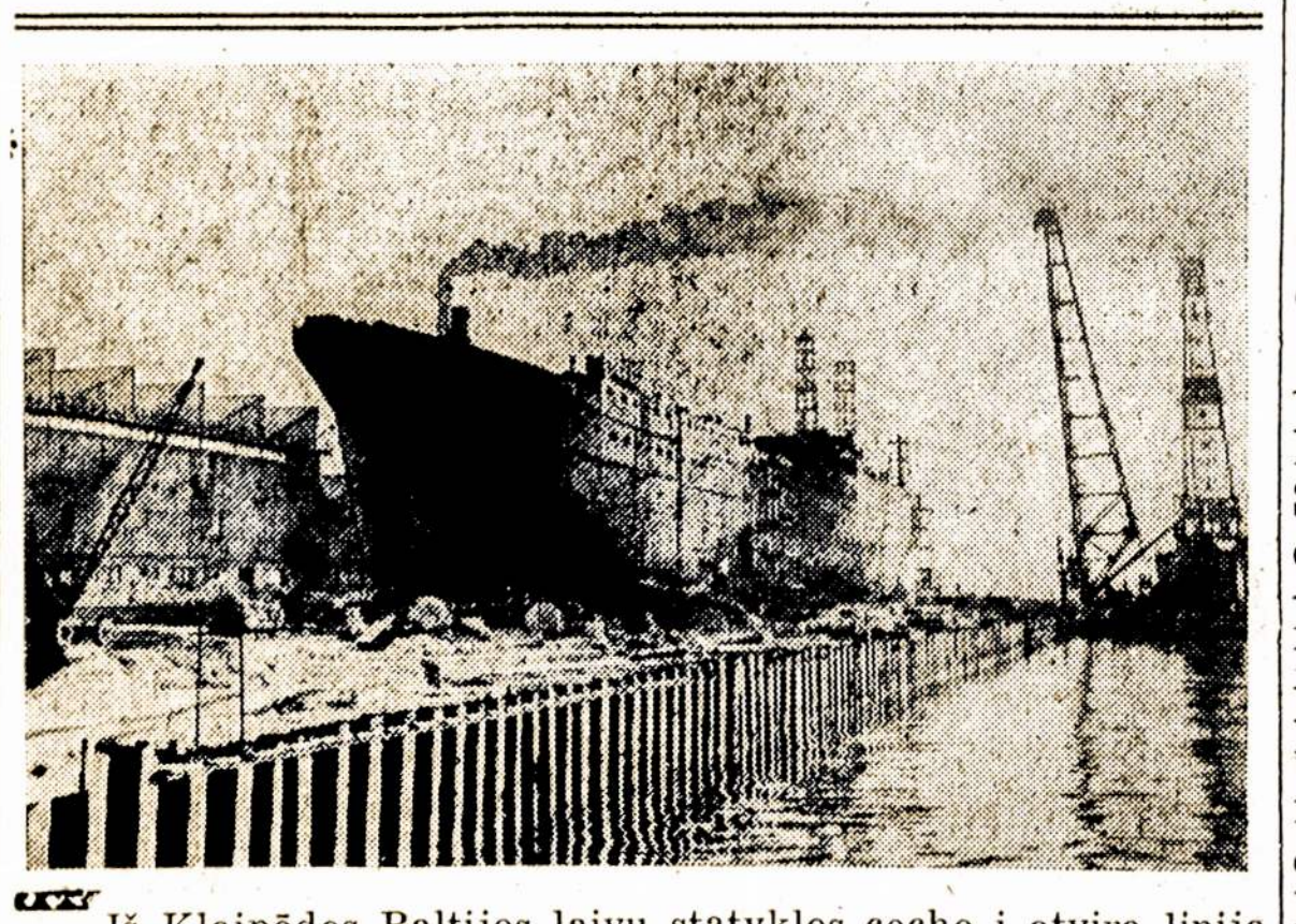
Iš Klaipėdos Baltijos laivų statyklos cecho į atvirą liniją išvežtos antrojo didžiojo žvejybos tralerio-saldytuvų sekcijos. Jos sumontuotos į vienalytį korpūsą. Naujųjų metų pradžioje šį tralerį Baltijos laivų statyklos kolektyvas perdavė respublikos žvejams.

Nuotraukoje: pirmųjų dviejų didžiųjų žvejybos tralerių-saldytuvų statyba Klaipėdos Baltijos laivų statykloje.