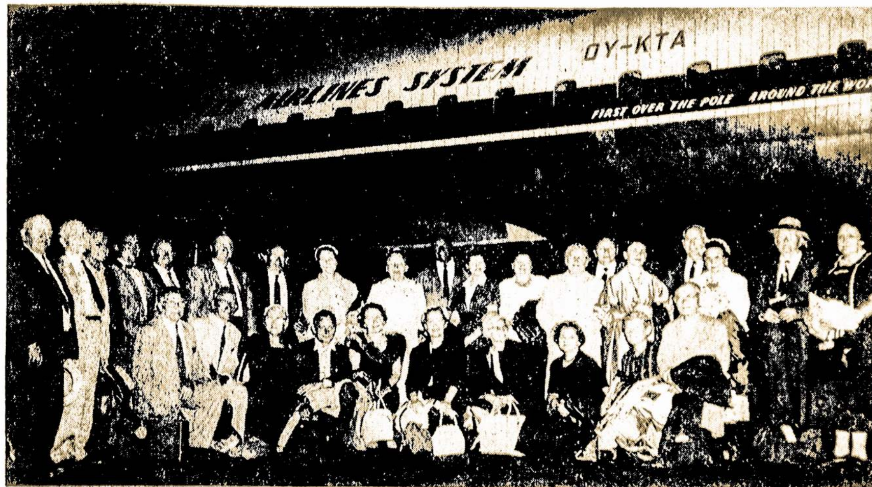
Čia matome dalyvius Jungtinių Valstijų lietuvių turistų pirmosios grupės. Nuotrauką padaryta New Yorko orlaukyje jai išvykstant į Lietuvą 1960 m. liepos 7.