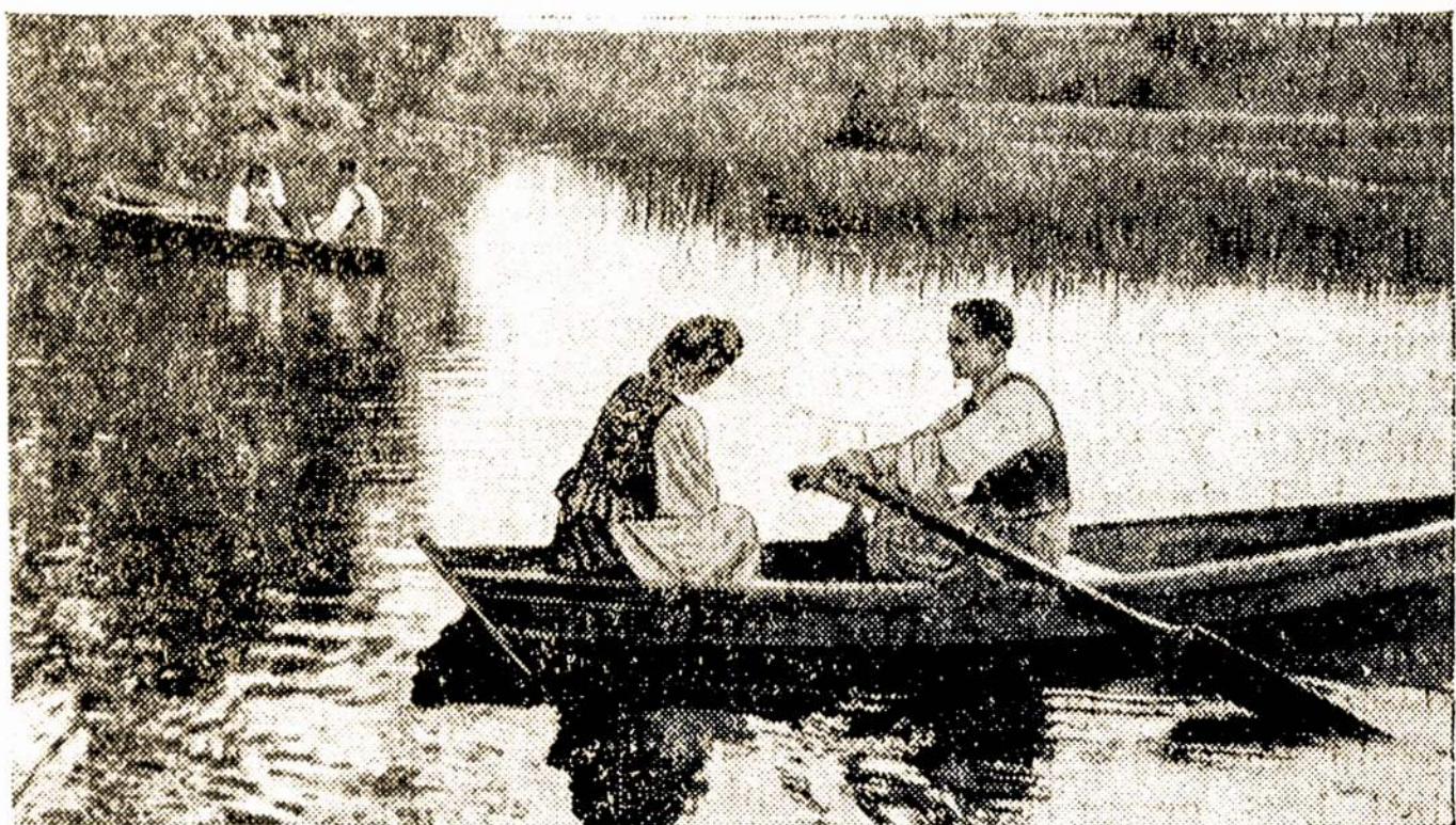
Lietuvos peizažas. Su valtelėmis...

Nuotraukoje: lankytojai prie "Technoeksporto" firmos eksponatų.