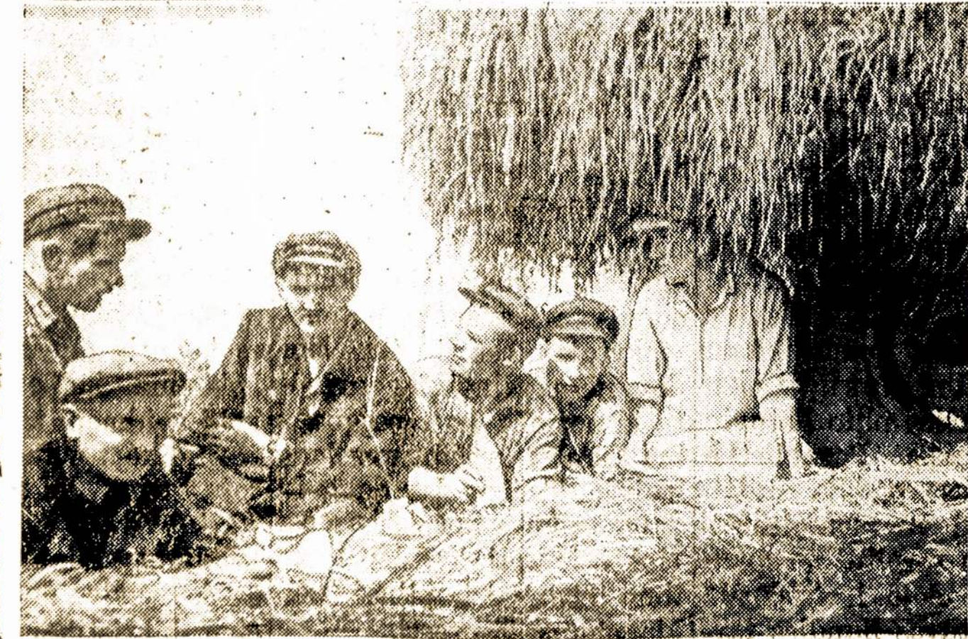
Šieno pjovėjų laivandėlė pailsi prie šieno pakrauto sunkvežimio (Šilutės rajonas, Sakučių tarybinis ūkis).