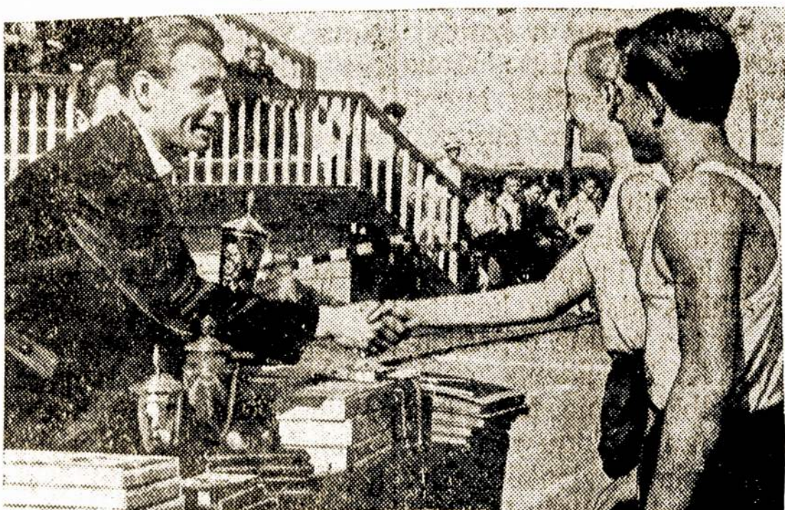
Vilkaviškyje įvyko moksleivių spartakiada. Varžybose vidurinių mokyklų tarpe pirmą vietą iškovojo Vilkaviškio S. Nėries vardo vidurinės mokyklos sporto kolektyvas.