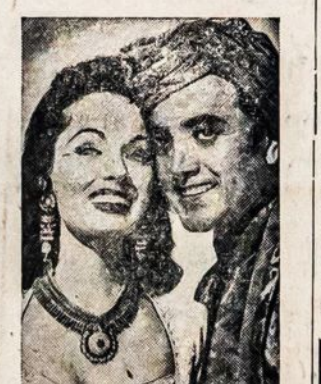
Ann Blyth and Vic Damone as the Kismet-crossed lovers in M-G-M's bewitching new musical, "Kismet," adapted from the long-run Broadway stage hit. Howard Keel and Dolores Gray form a second singing romantic team in an eye-filling story of adventure and romance in ancient Baghdad.

Kirtimasis toks: valstijinis įstatymas sako, kad nelegalu tokius vartoti "neteisiems" tikslams. Tai ir viskas. O miestinis įstatymas turi dantis: įsakytą pardavėjas bausti $1,000 arba metus kalėti, arba gali skirti abi pabaudas.