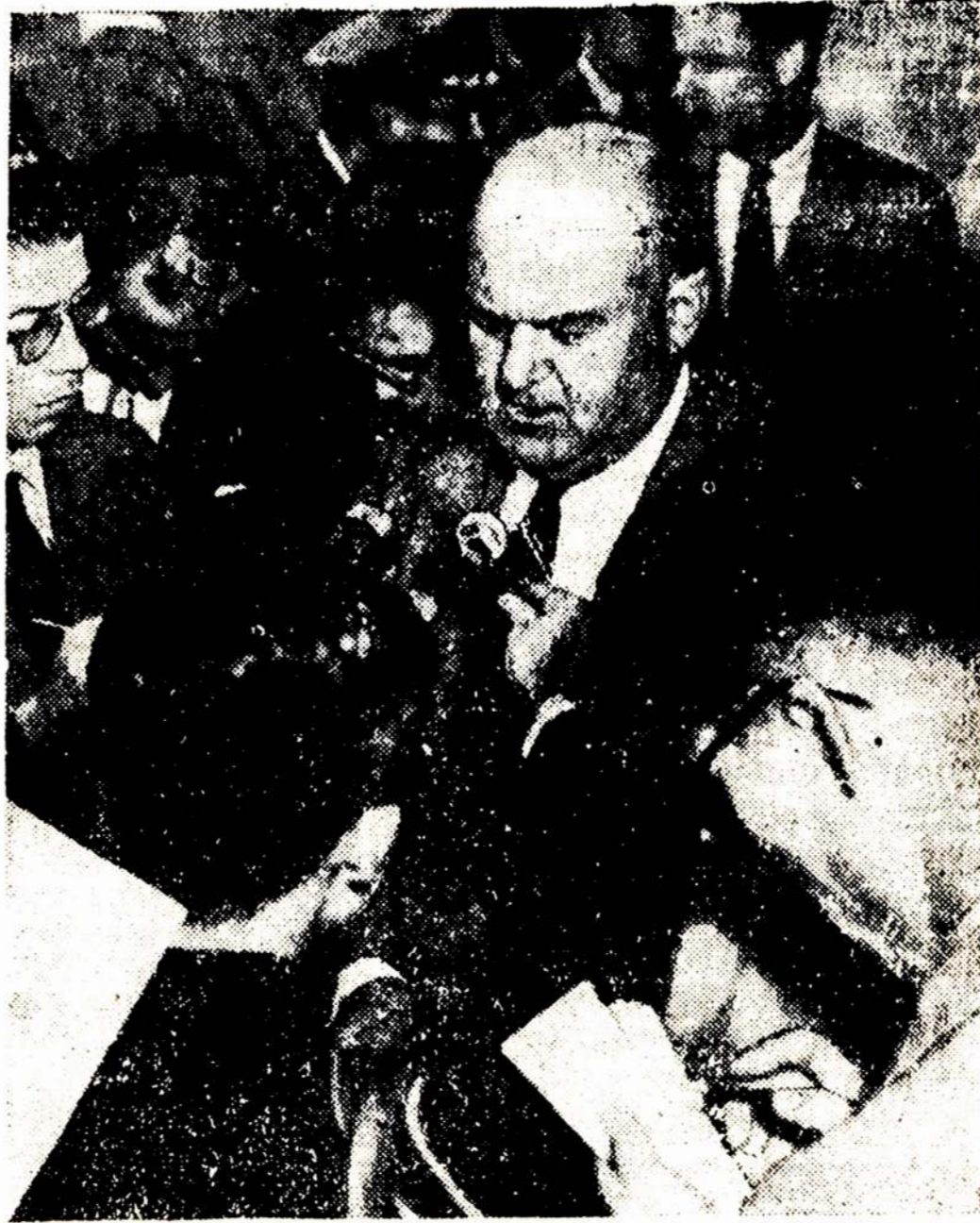
Pono Dulleso paskirtinis Arthur H. Dean atvyko į Pnamundžiom. Reporteriams pasakoja atvykęs sušaukti politinę konferenciją su Šiaurii Korėjos ir Kinijos atstovais. Dean yra dalininkas buvsios Dulleso advokatu firmos, Wall Stryte žinomos kaip Sullivan ir Cromwell firma.