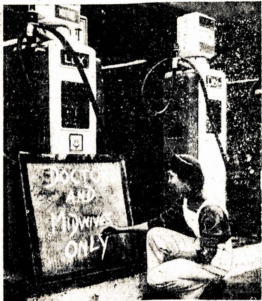
Londonė sustreikavus sunkvežimiu vairuotojams stotyse pritrūko gaso. Tad stoties prižiūrovė išrašo pranešimą, kad gaso parduos tik daktarams ir akušerėms.