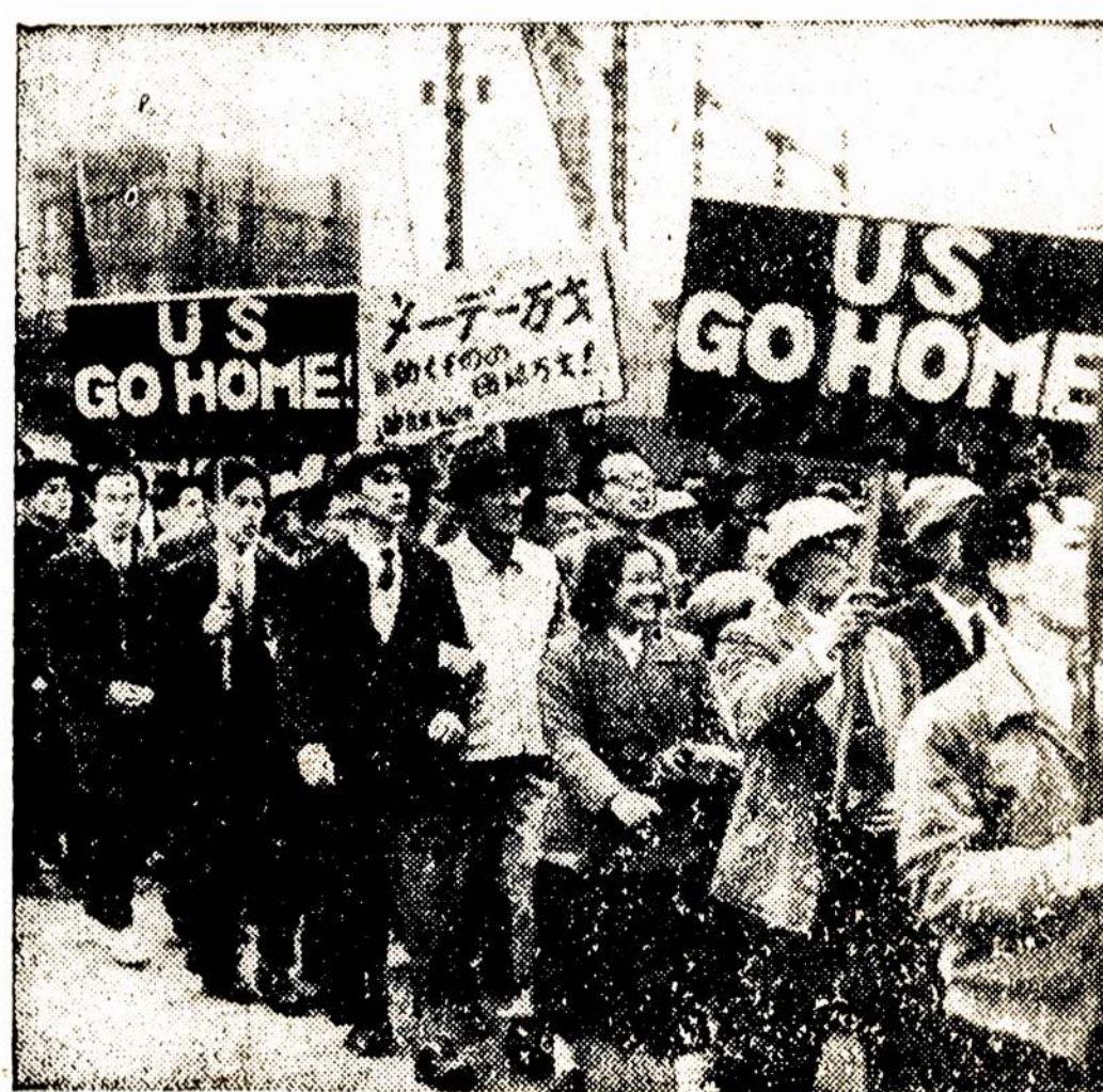
Vaizdas Japonijos sostinėje Tokyje laike Pirmosios Gegužės demonstracijos. Daugiausia iškabų buvo: "U. S., go home!" Tai yra, Jungtinės Valstijos, va- žiukite namo!