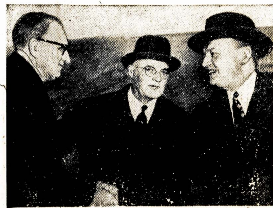
Valstybės sekretorius Dulles (centre) ir savitarpio saugumo administratorius Stassen (dešinėje) atsisveikina su savo draugais, vykdami į Europą įtikinti jos vadovus, kad Eisenhoweris nemano praplėsti karą. Bet pasirodo, kad jie negalėjo įtikinti. Europa yra labai susirūpinusi prez. Eisenhowerio patvarškumu Kinijos klausimu.