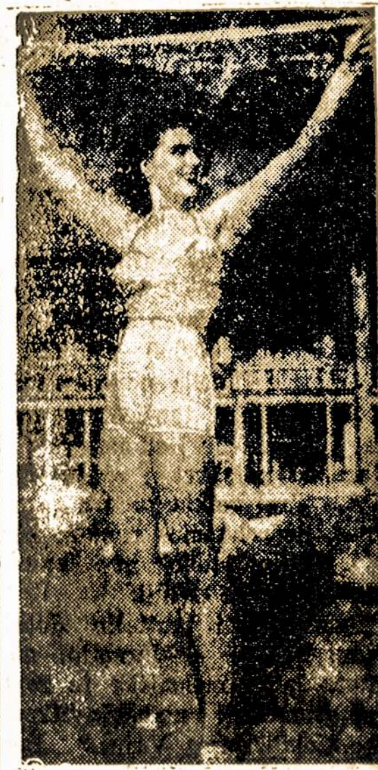
Grazioji filmų aktorka Peggy Castle. Tuo laiku karštis Californijoje bu-vo labai didelis. Čia Peg-gy laiko iškilus nosinę, kad suradus iš kur vėjas pučia.

Brussels. — Belgijos val-džia nužiūri, kad tarp civi-lių jos tarnautojų — valdi-ninkėlių yra 300 iki 500 komunistų; ketina visus juos pašalinti.