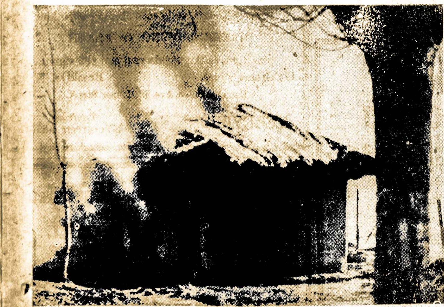
Tai padegtas korejiečio namas. Vedant šiandien "scorched earth" politiką Korėjoje, panasiai nuo žemės paviršio nušluojama visi namai, kurie pasitaiko armijų kelyje.