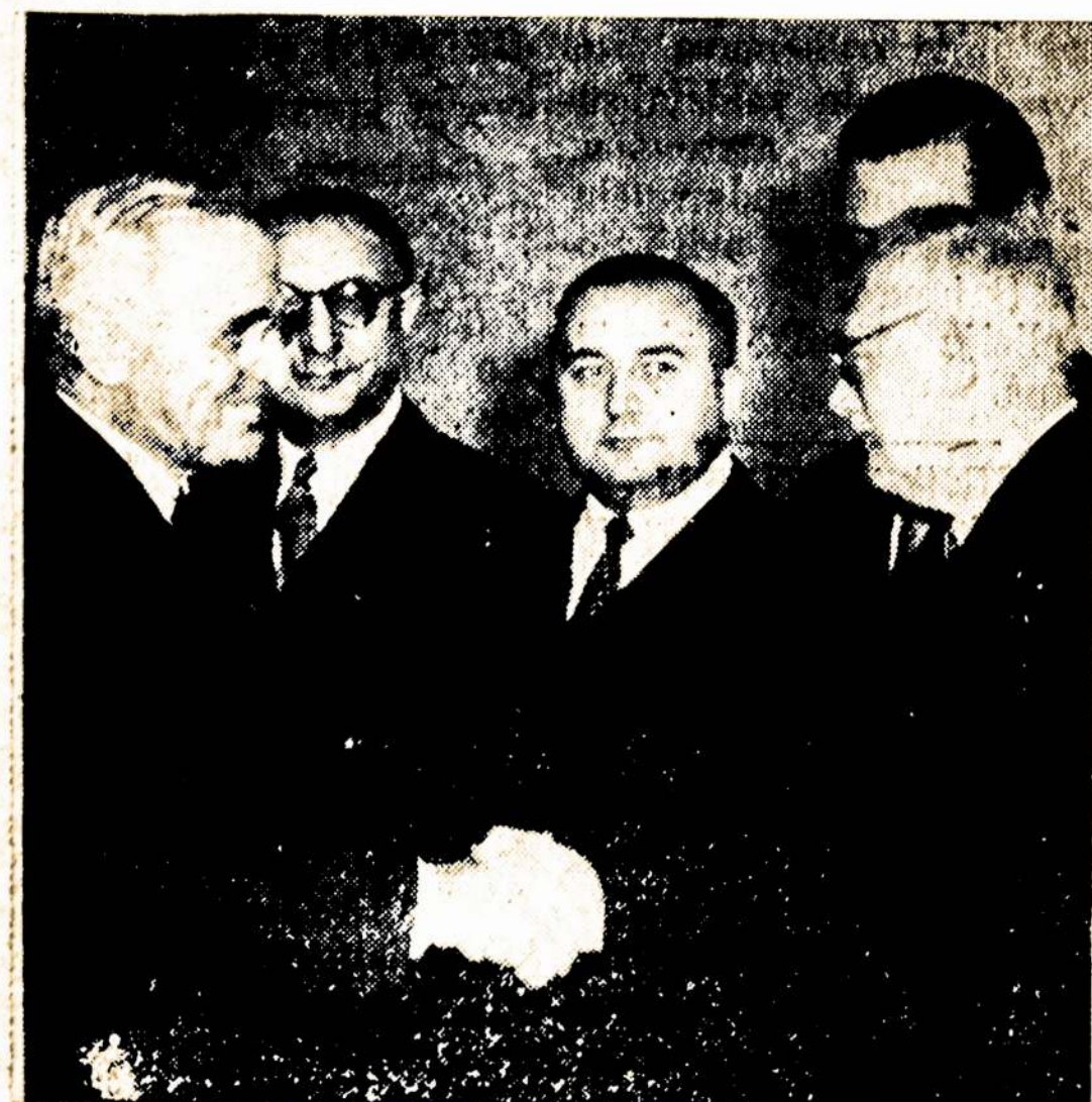
Prez. Trumanas ir Tarybų Sąjungos užsienio ministras Višinskis sveikinasi Jungtinių Tautų susirinkimo name, kaip prezidentas ten apsilankė.

Dabar aišku, kad buvo padaryta klaida, kai nebuvo priimtas Indijos planas, patiektas Jungtinių Tautų Asemblejoje, baigti šį prazūtingą karą. Indija siūlė, kad nereikia žengti per 38-tą paralelę, kad reikia sulaukyti mūšius ir taikias budais Jungtinių Tautų vadovybėje išspręsti visą Korėjos problemą. Bet dauguma nepaklausė to sveiko, išmintingo patarimo. Dabar turime rezultatus.