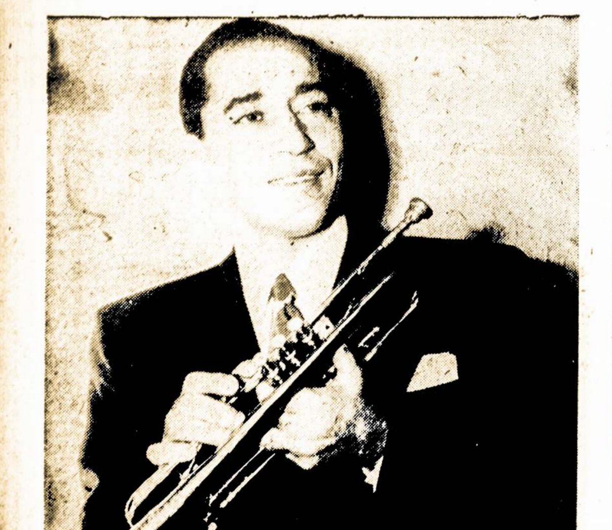
Louis Prima asmeniškai dalyvauja scenoje New Yorko Paramount Teatre greta ten rodomos filmos "Irma Goes West."