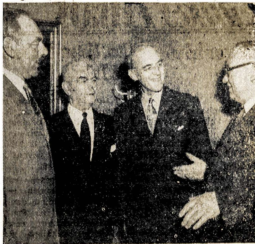
Britanijos, Kanados ir Jungtinių Valstijų kabinetų viršininkai buvo suvykę į Washingtoną pasitarti dėl Britanijos dolerio krizės. Iš kairės: mūsų valstybės sekretorius Dean Acheson, izdinės sekretorius John W. Snyder, Britanijos izdininkas Sir Stafford Cripps (kurio valstybė vis labiau krypta į Amerikos finansierių kišenių, nežūrint mūsų taksais duodamos valstybei pagalbos einant Marshallo planu) ir užrubežiams ministras Ernest Bevin.