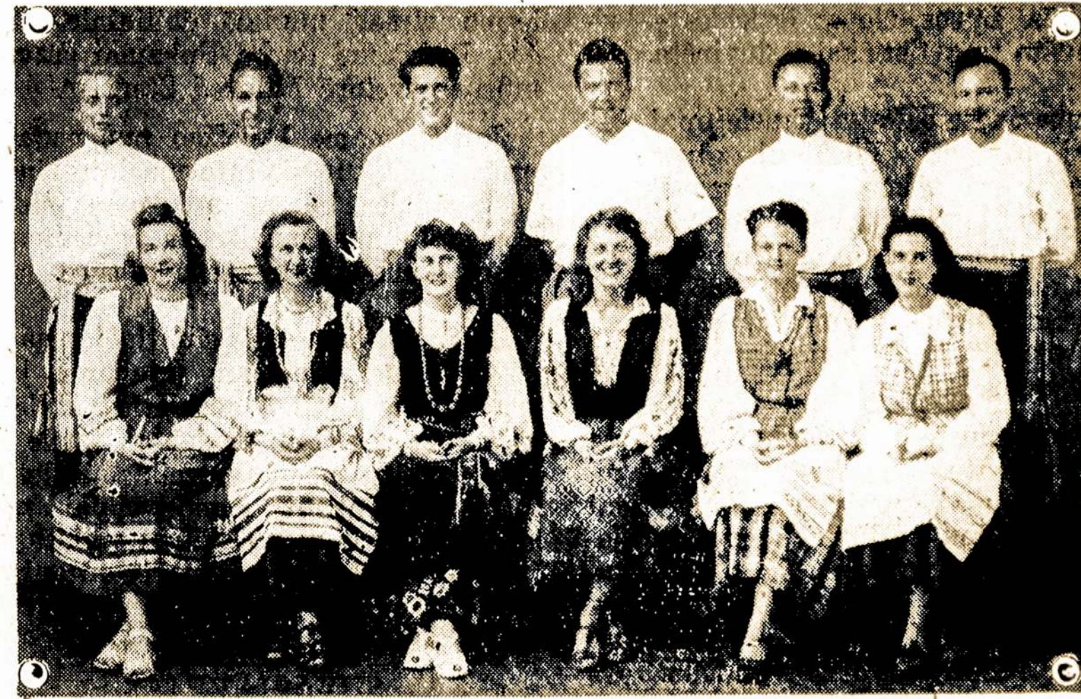
Šis paveikslas yra pereinų metų, tačiau dauguma tų pačių studentų yra ir šiame

So. Quinsigamond Ave., Shrewsbury, Mass.