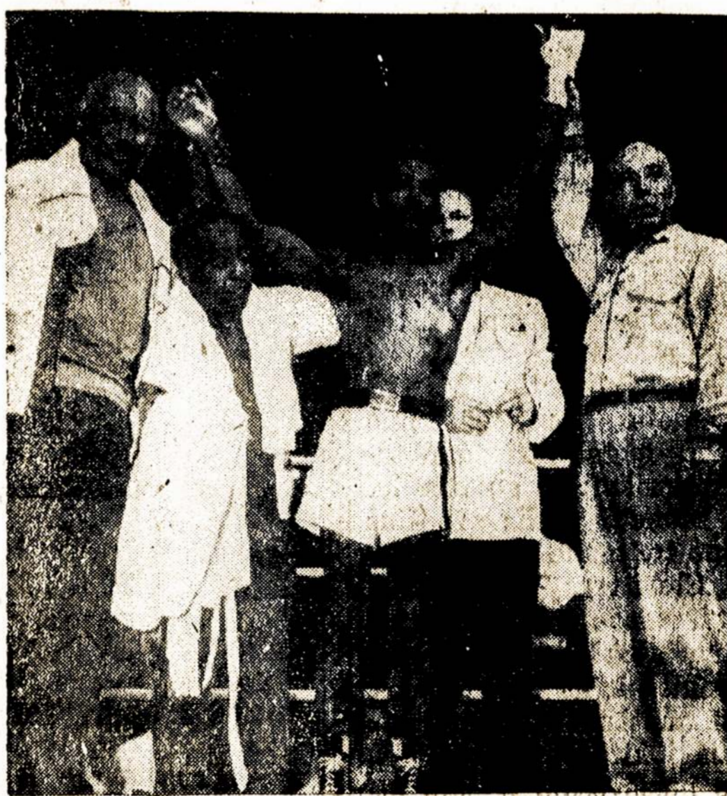
Newyorkietis lengvojo svorio kumštinkas Ray Robinson, 28 metų, su iškeltomis abiemis rankomis džiaugiasi išlaikęs pasaulinį čempiono titulą prieš Kid Gavilan iš Kubos. Kumštynės įvyko Philadelphia Municipal Stadium.

4 pusl.—Laisvė (Liberty, Lith. Daily)—Ketv., Liepos 28, 1949