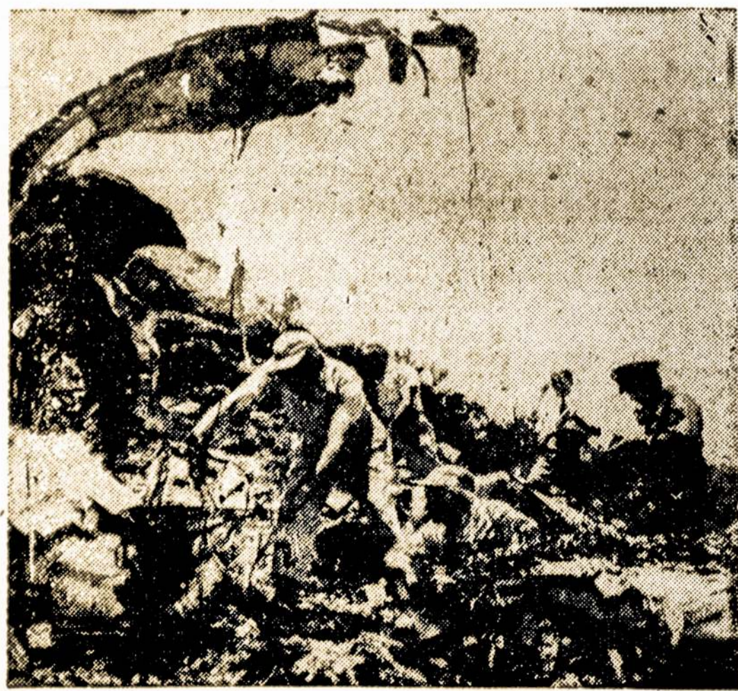
Valdiniai saugumo inspektoriai apžvelgia "saugiai" sudegusio, ne labai saugiai pakibusio ant žlauto didelio lėktuvo anglimi pavirtusius griaučius. Lėktuvui susikūlus į kalną ties Chatsworth, Cal., 35 asmenys mirė, 14 sužeisti. Tikrai keliomis dienomis pirm tos nelaimės AFL ir CIO unijos šaukė, jog be tinkamos priežiūros ir be ekspertų unijist darbinių skraidymas yra visuomenei nesaugus. Bet kas čia mūsų valdinėse įstaigose darbininkų balsą nori išgirsti?

Tai buvo seniai, dar prieš Pirmą Pasaulinį Karą. Atvykau į Jungtines Valstijas tiesiai į "Broliškis Meilės" miestą, kaip jį seniau vadino, arba kaip dabar — Philadelphia.