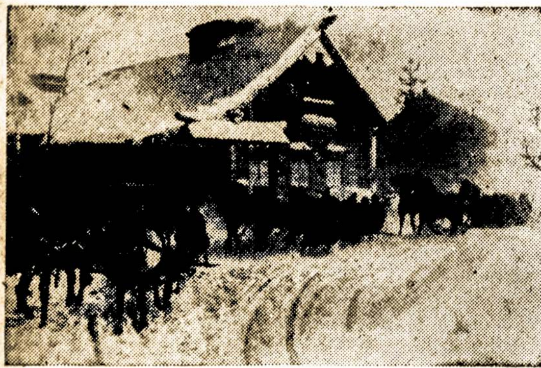
Scena iš Artkino "Symphony of Life," naujos Tarybų Sąjungos spalvinės filmos, su muzika, pradėsimos rodyti Kalėdų dieną, Stanley Teatre, 7th Ave. ir 42nd St., New Yorke.

6 pusl.—Laisvė (Liberty, Lith. Daily)— Treč., Gruod. 22, 1948