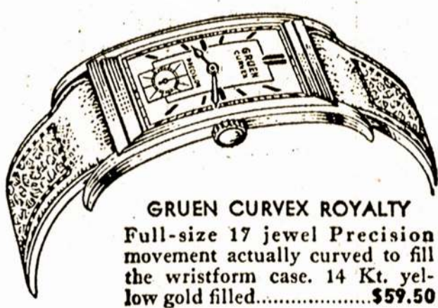
GRUEN CURVEX ROYALTY Full-size 17 jewel Precision movement actually curved to fill the wristform case. 14 Kt. yellow gold filled. $57.50