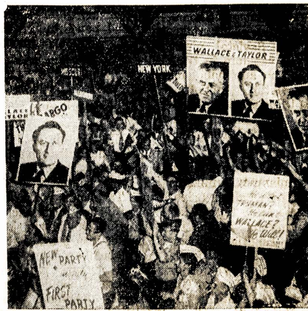
Vaidzas iš suvažiavimo Progresyvei Partijai kurti: delegatai demonstruoja didžiulėje Auditorijoje po to, kai Wallace buvo nominuotas kandidatu Jungt. Valsčių prezidento vietai.

tojas. Jis yra tautinių grupių divizijos pirmininkas. Amžiaus — virš 70 metų.