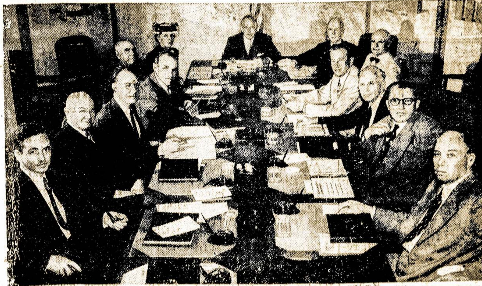
Prezidento Trumano paskirti patarėjais vykdydami Maršalo Plano susirinko Washing-tone su toms pareigoms paskirtu administratorium Paul G. Hoffman.

Užsakymus prašome siųsti šiom antraštė: LAISVĖ, 427 Lorimer St., Brooklyn 6, N. Y.