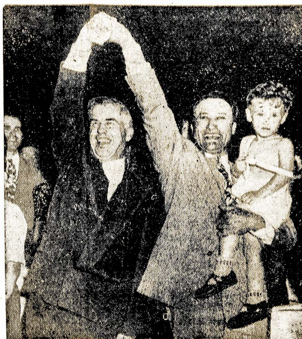
Progresyvsės Partijos kandidatai—Wallace ir Taylor—sveikina suvažiavimo dalyvius, kurie juodu nominavo; suvažiavimas įvyko liepos 23-24-25 dd. Philadelphiaj.

Tabako kompanijos parangins cigaretes centu pakeliui.