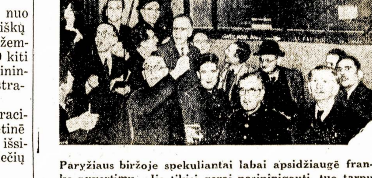
Paryžiaus biržoje spekuliantai labai apsidžiaugę franko nuvertimu. Jie tikisi gerai pasipinigauti, tuo tarpu Francūzijos darbininkams reikią kainų pakilimą ir abelnei gyvenimo pasunkėjimą.

Sąstatas dabar sudarytos ūkinės administracijos rytinei Vokietijai yra toks: Pirmininkas, 2 pirmininko pavaduotojai, 3 Laisvųjų Darbo Unijų Sąjungos at-