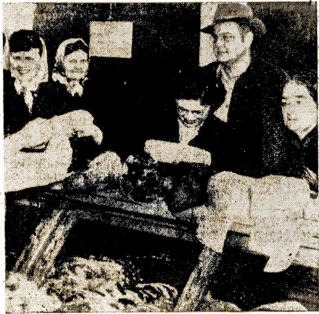
Aną dieną St. Helena, Ore., mėsos krautuvių savininkai nusitarė praveisti draugišką kainų numušimo lenktynes. Buvo prieita prie to, kad beveik už dyką mėsa buvo duodama. Kai žmonės sužinojo, pradėjo miestelį plaukti iš viso: apylinkės. Tuojau mėsos pritrūko, o ant rytojaus vėl kainos ne tik pasiekė pirmesnę lygį, bet dar kelias centais pakilo.

Prie progimnazijos yra mokinių bendrabutis.