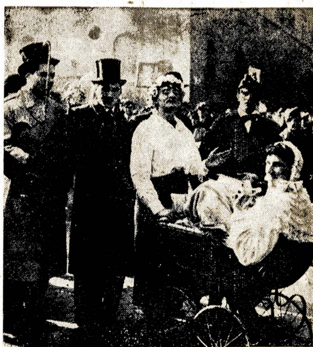
Italijos studentai šposauja, vienas kitą veža vaikų vežimėlyje ties Piazza Venezia, kur Mussolinis dažnai sakdavo kalbas.

Didžiojo kareivinėj Ba-ri kareiviai streikavo, gulė-dami lovose. Bracciano mie-gaukiai.