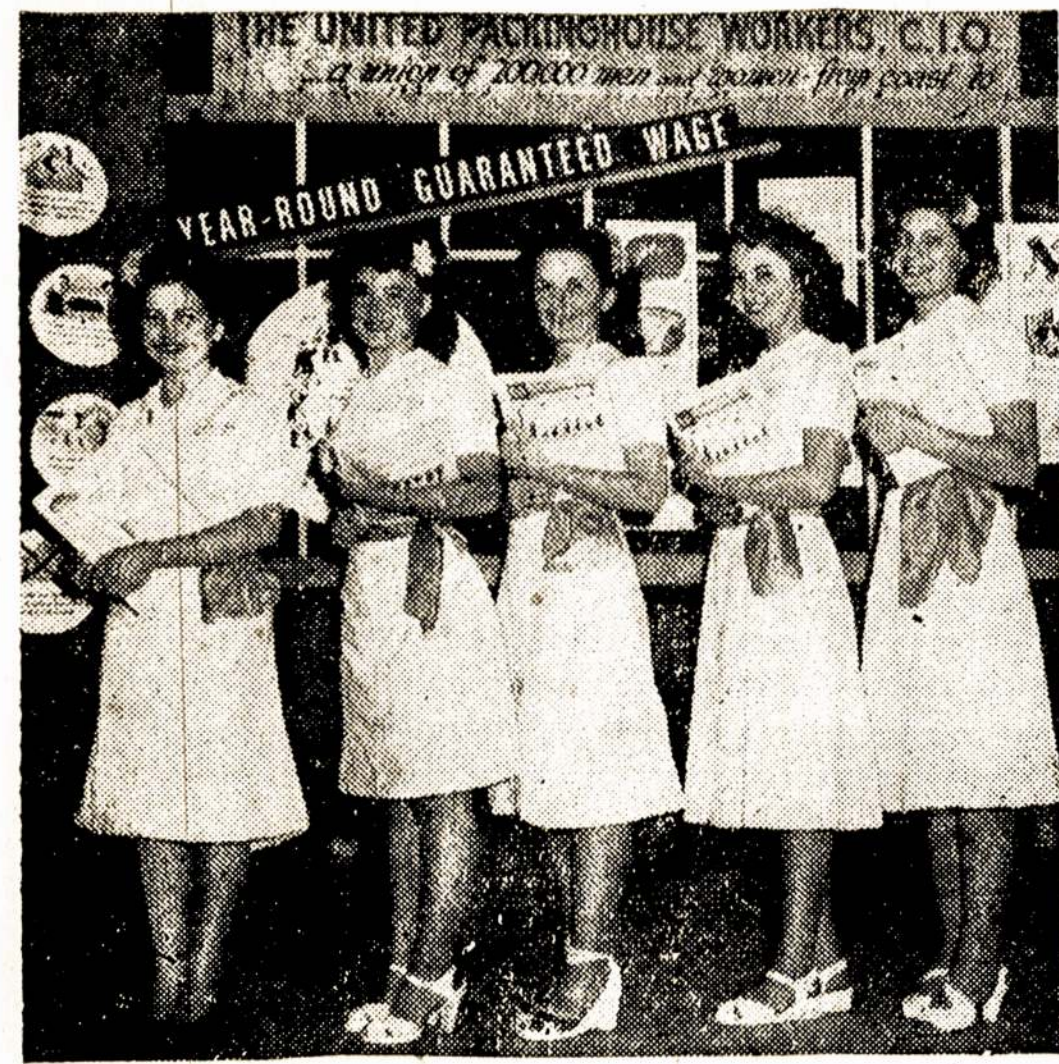
Šios gražios CIO United Packinghouse Workers narės buvo įrengusios speciale paroda Minnesotos valstijos fermerių feruose. Tūkstančiai fermerių atlankė jų skyrių ir kalbėjosi su unijistėmis, išsiaiškino, dėl ko gyvoja unija ir kaip ji tvarkosi, ku unija artima darbo fermeriams.

Rengia LLD moterų kuopa ir kviečia visus atsilankyti. Rengėjos.