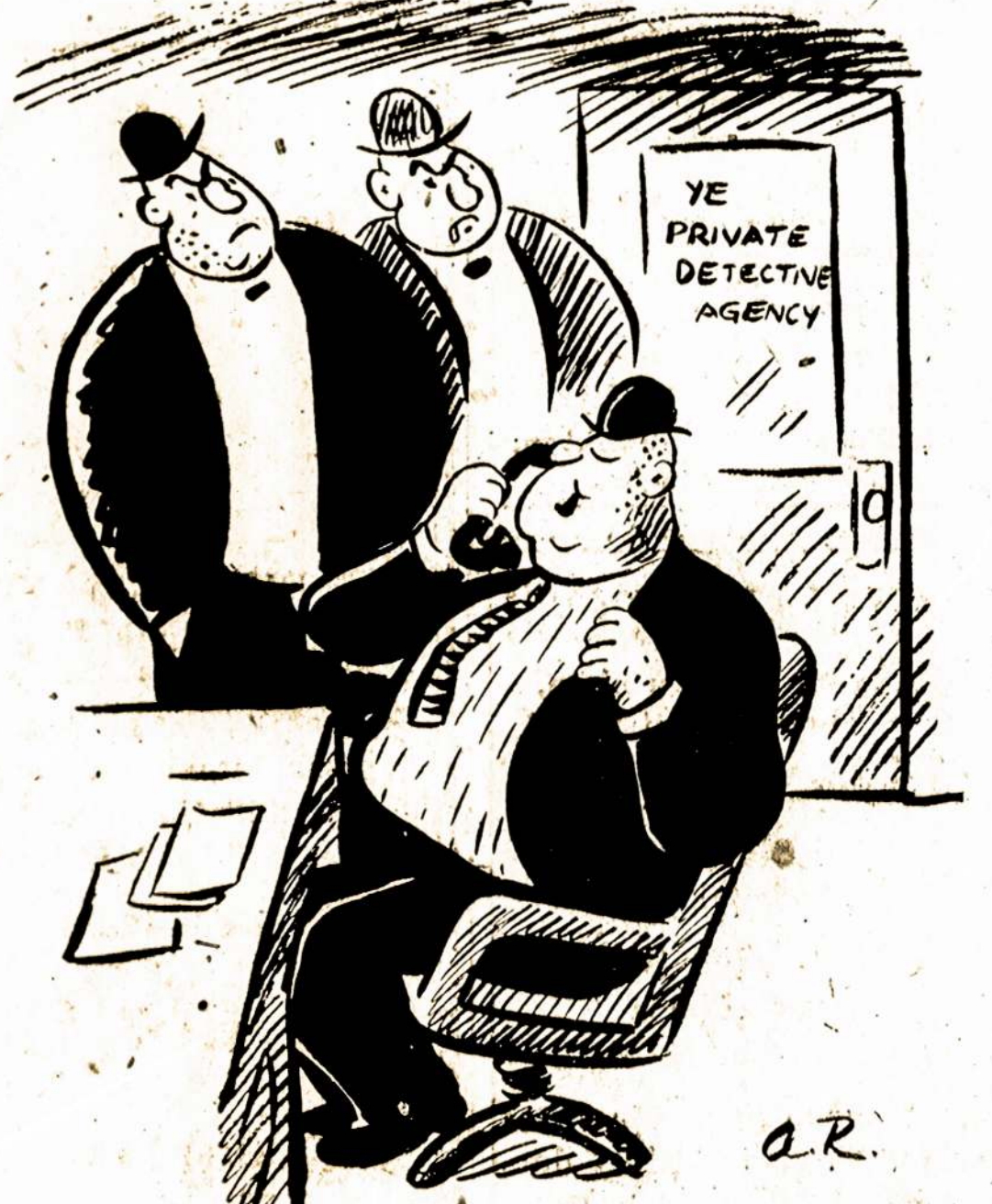
"Taip, mes vėl sugrįžome į strėkl... — norėjau pasakyti — šiomis dienomis vėl biznivojame."

5 pusl., Laisvė (Liberty, Lithuania, Daily), Pirm., Rugs. 15, 1947