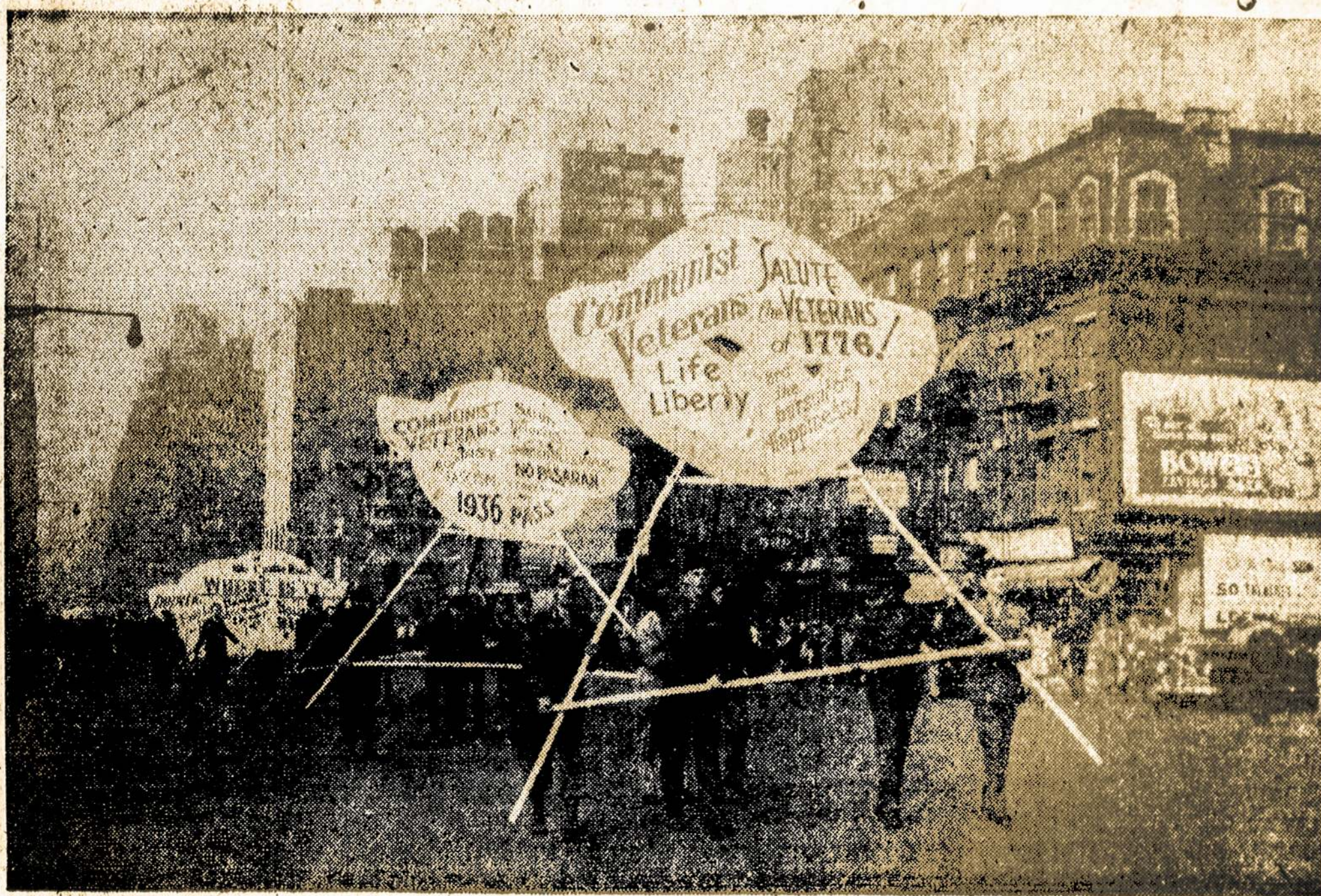
"Viešpatie! Tiek daug jų!" išsireiškė su nuostaba ne vienas newyorkietis, kurie buvo skaitę komercinėje spaudoje ar girdėję per radiją, būk komunistai esą mūsų šalies priešai. O čia ateina veteranų uniformose ir didvyrių medaliais pasidabinę. Gi tos ant aukščiausių karčių iškeltos įdomių formų iškabos rodo, jog jie nei mažiausia nesidrovi buvimo didvyriais komunistais. Priešingai, stengi asi, kad "visac svietas" juos pamatytų jais esant.

met sakydavau... Karolina ūmai pakilo nuo stalo ir išėjo. Tėvas su motina susižvilgėjo ir išėjo iš paskos. Marijonas kūrį laiką jautėsi nejaukiai, bet suvalgęs dar keletą tešlainių, atgavo pirmą kartą nuotaiką. — Danutė, tamstos sesuo, Karolina, labai panaši į tamstą iš veido, iš plaukų, bet tamsta, taip sakant, šituose drabužiuose dešimt kartų žavesnė. Aš norėjau su tamsta rimtai pasikalbėti. — Apie ką? — garsiai nusijuokė Danutė. — Jūs kareivis, jei taip galima išsireikšti, jūs paratusi juoktis iš mirties, — pastūmė jis nuo savęs lėkštę. — O aš... nors Karolina ir labai pyksta... tave mylėčiau ir tebemyliu! (Bus daugiau)