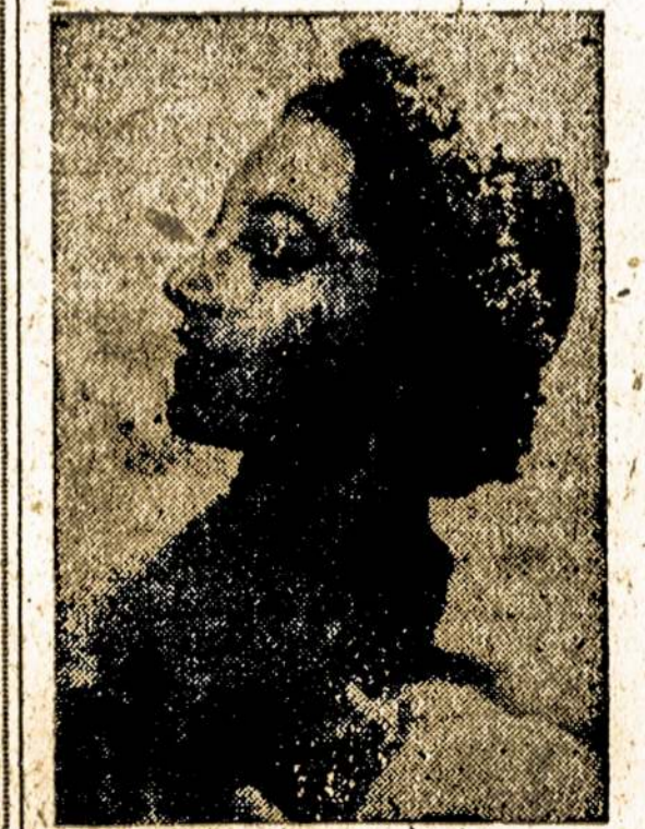
LUCIA CHASE, žymi šokėja Ballet Theatre kompanijoje, dabar koncertuojančioje City Center, 131 W. 55th St., New Yorke. Baletu trijų savačių gastrole mūsų mieste baigiasi gale šios savaitės.

Waterbury, Conn.—Rugpj.-Aug. 3 LIETUVIŲ PARKE, CHESTNUT RD. RENGIA LDS IR ALDLD APSKRIČIAI