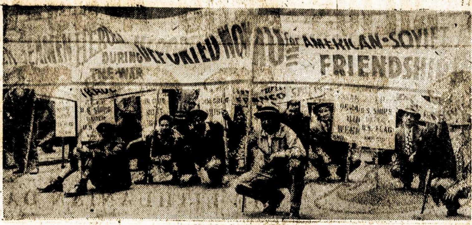
Prekminio laivyno marininkai susirikiavę maršuoti Bendros Gegužinės Parade, New York'e.

Šitie darbininkai ne tik gauna 15 centų algos pakėlimą per valandą, bet taipgi samdytojų kaštais įvedimą apdraudus sistemas. Kiekvienas darbininkas apdraudžiamas ant $4,000, kitus $4,000 gaus darbininko šeima, jeigu jis būtų užmuštas. Susirgęs darbininkas gaus $15 savaitinės pašalpos per tryliką savaičių. Jeigu jam prisels susirgus eiti ligoninėn, kasdien jis gaus po $5 padengimui ligoninės išlaidų. Jeigu prisiebtų daryti operaciją, darbininkas gaus iš kompanijos $150 apsimokėti gydytojui.