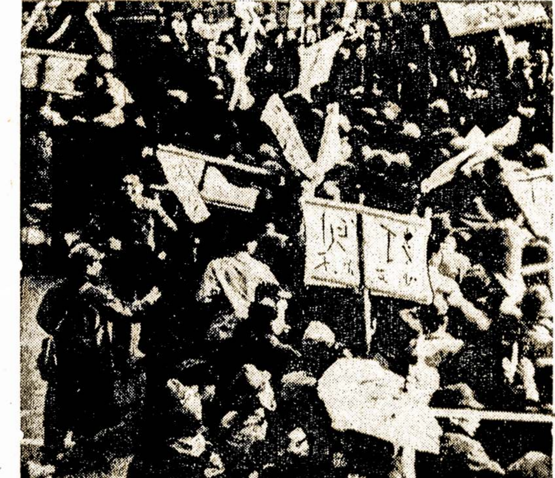
Tūkstančiai Japonijos darbininkų demonstuoja priešais Tokio imperatoriškas palaciu. Jie kaltina premjero Yoshidos valdžia nustūmus darbininkus į skurdą. O kadangi ta valdžia buvo mūsų karinės vyriausybės užgirta, tad japonai ir mus skaito ne kažin kokiais dėdėmis.

Maskva. — Sovietai įsileis 36 Amerikos korespondentus aprašinėti ir fotografuoti keturių didžiųjų tautinių uzsieninių ministrų konferenciją Maskvoje. Jungtinių Valstijų valdžia buvo prašius priimti 73 jų korespondentus. Sovietai, pamažindami jų skaičių, pranešė, jog ir Maskvoje nėra atliekamų kambarių. Apart Amerikos valstybės sekretoriaus Marshallo,