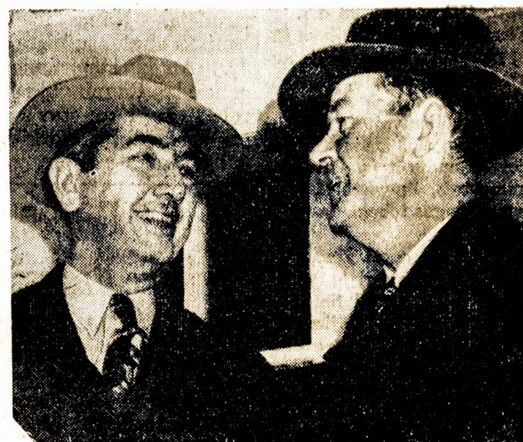
Generalis prokuroras Tom Clark ir demokratų partijos pirmininkas Robert E. Hannegan išėina iš Baltojo Namų po kabineto susirinkimo. Spėjama, kad gal kabinetas užgyrės Hannegan'o prakalbą, kurioje jis sakė, kad jo partija prašysianti prez. Trumano kandidatuoti 1948 prezidentiniuose rinkimuose.

Kaip gi su lietuviškais fašistais? Jie patys nuvertė liaudininkų - socialdemokratų valdžią 1926 metais, (Tąsa 3-me pusl.)