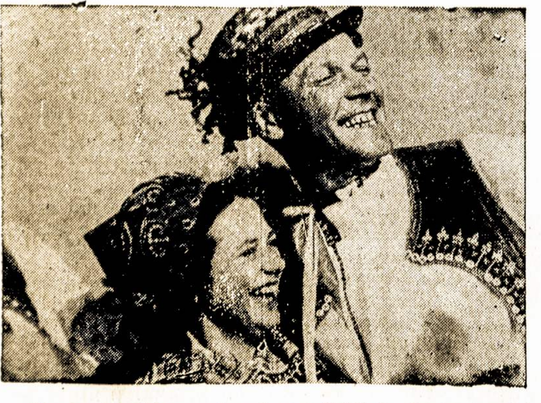
Ši porėle džiaugsmingai apvaikėčioja Čechosllovakijos išlaisvinimą. Scena iš filmos "Liberation in Europe", naujos, dokumentalės Sovietų filmos, Stanley Teatre, 7th Ave. ir 42nd Street, New Yorke.