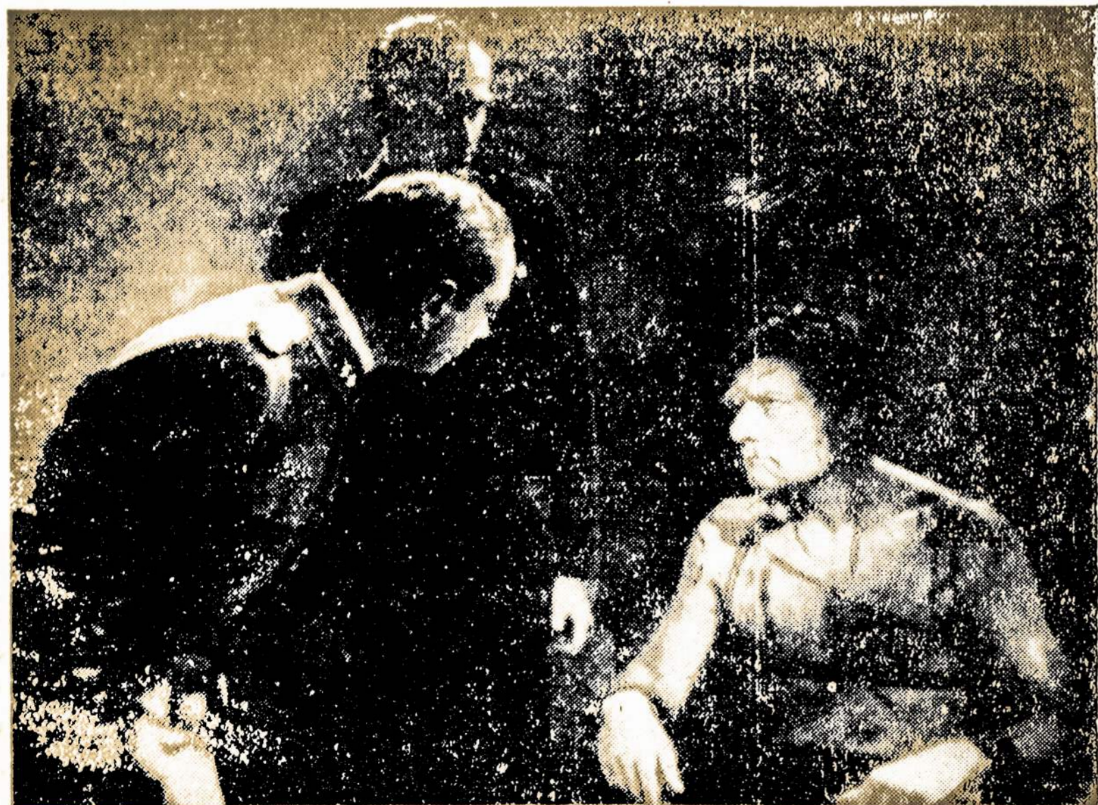
Scena iš itališkos filmos Open City parodo Manfredi, Italijos partizanų vadą, kankinamą gestapo agentų. Vėlykų savaitę filma pradėta rodyti Bostone, Buffalo, Chicagoje, New Haven, Philadelphia, Pittsburgh, Washington. Filma gamino, dirigavo ir suvaidino žmonės, kurie patys buvo Italijos priešfašistų partizaniniame judėjime. Kritikai ją pripažino žymia priešfašistine filma.

Cukraus stampos 39-tos laikas baigsis šio mėnesio 30-tą. Gegužės 1-mą jeis galion spare stamp 49, ketvirtoj kny-gelėj, taipgi specialėj cukrui pirkti knygelėj, išduotoje ve-teranams, vietoje anų, senųjų.